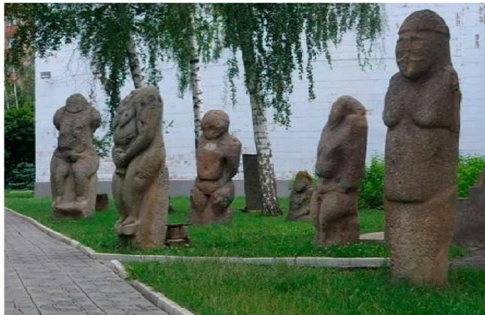
Половцы XI-XII в.

Донецкие степи стояли на пути переселений народов и были открыты всем ветрам. Неудивительно, что через степи прошли скифы, сарматы, гунны, готы, аланы, хазары, печенеги и половцы, оставившие здесь немалые следы своей материальной культуры.