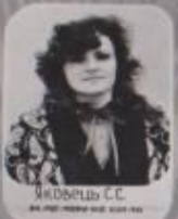
Я. Яковець С. С. ВІДП. ЗА