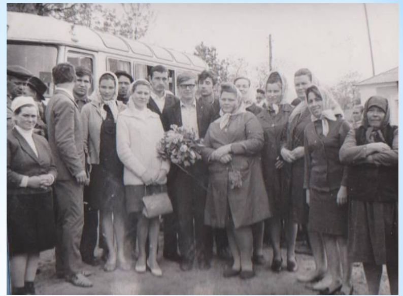
* Жилівська восьмирічна школа