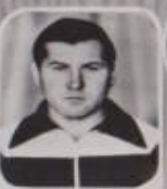
П. Писку В. В. ВІДП. ЗА НАСТАВНИКА