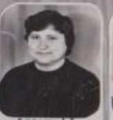
В. Васкан А. В. ПЕРШИЙ ЗАПОВІДНИК 9 КЛ.