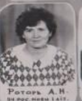
Р. Ротор А. Н. ВІДП. ЗА РОС. МОВУ І ЛІТ.