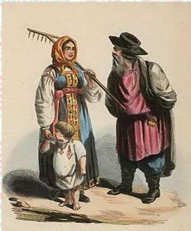
Крестьяне Пермской губернии 1844 год

Русские — восточнославянский народ. Один из коренных народов России.