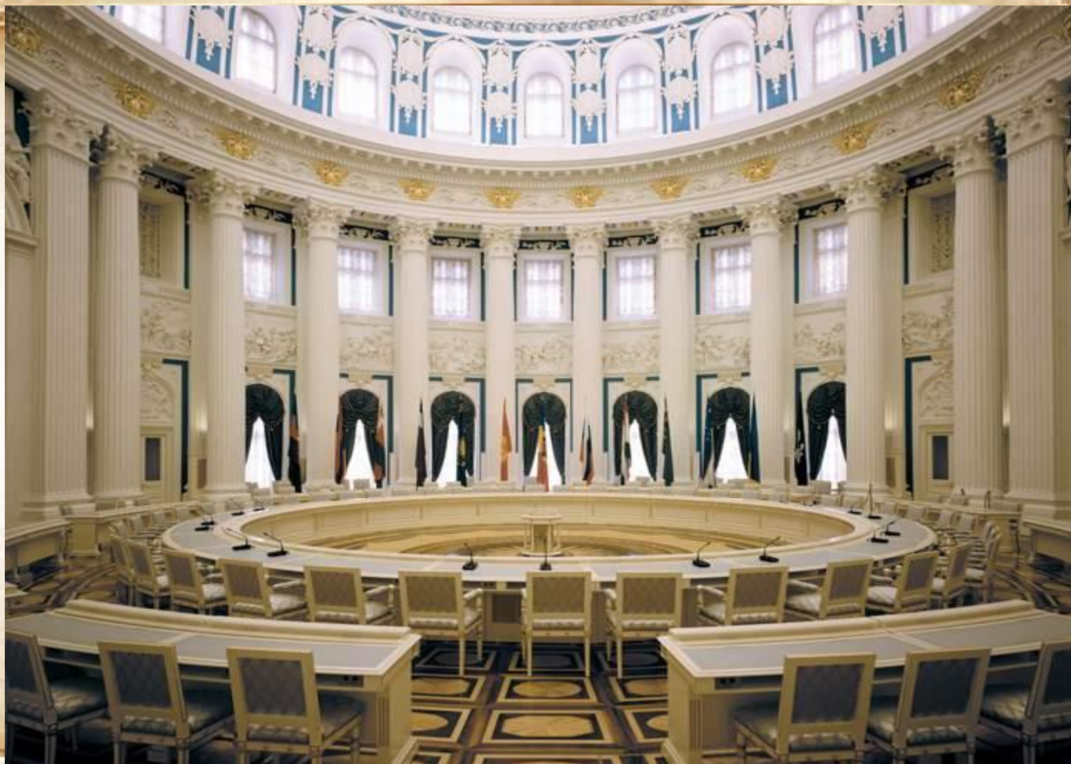
Екатерининский зал дворца.