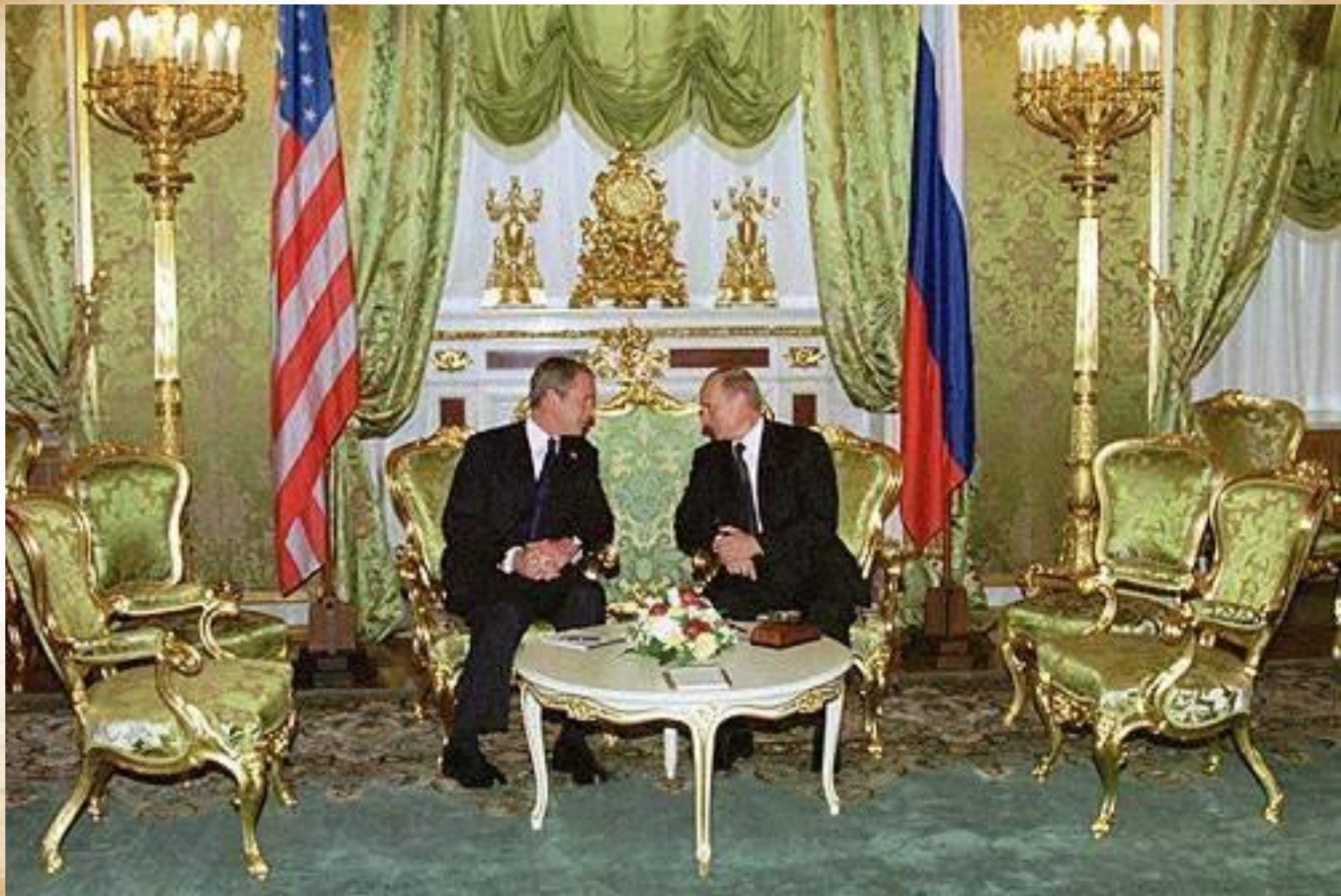
Парадная гостиная дворца.