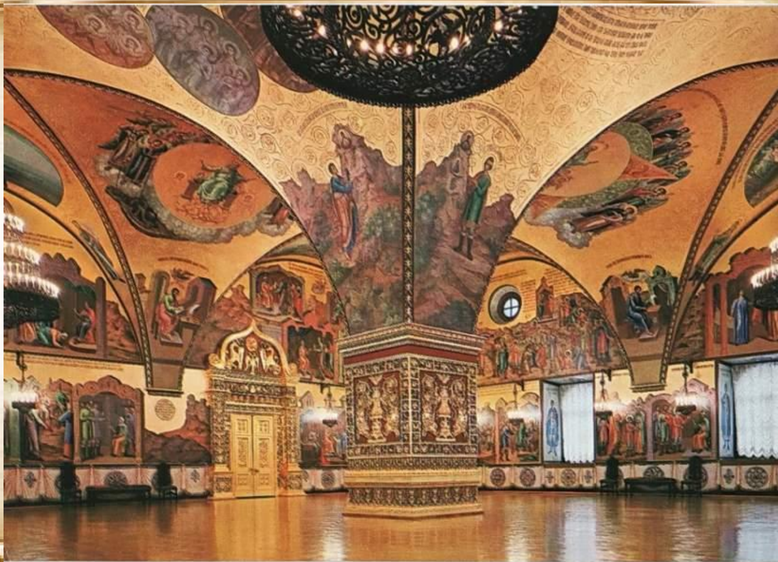
Интерьер Грановитой палаты