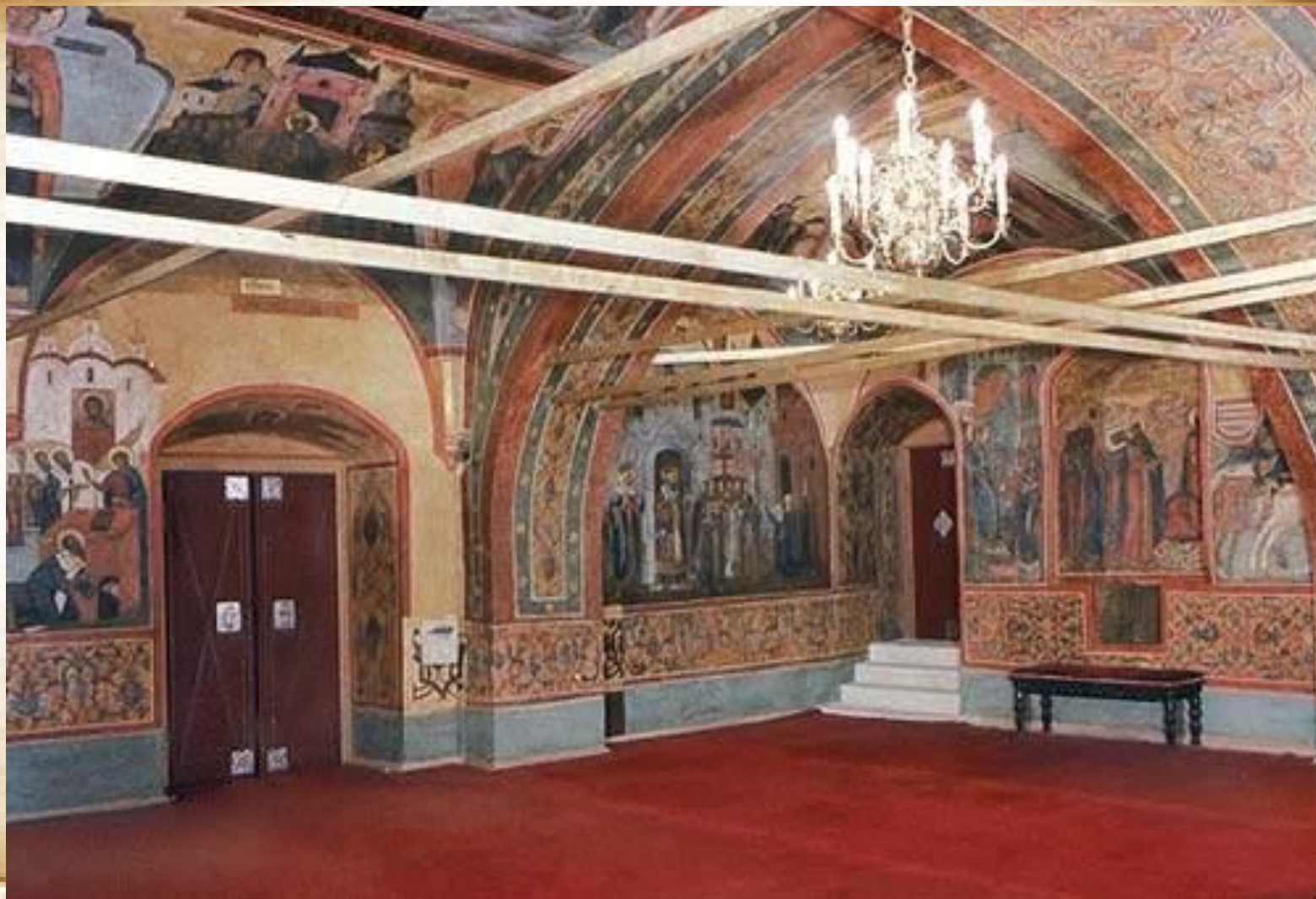
Золотая Царицына палата (XVI век)