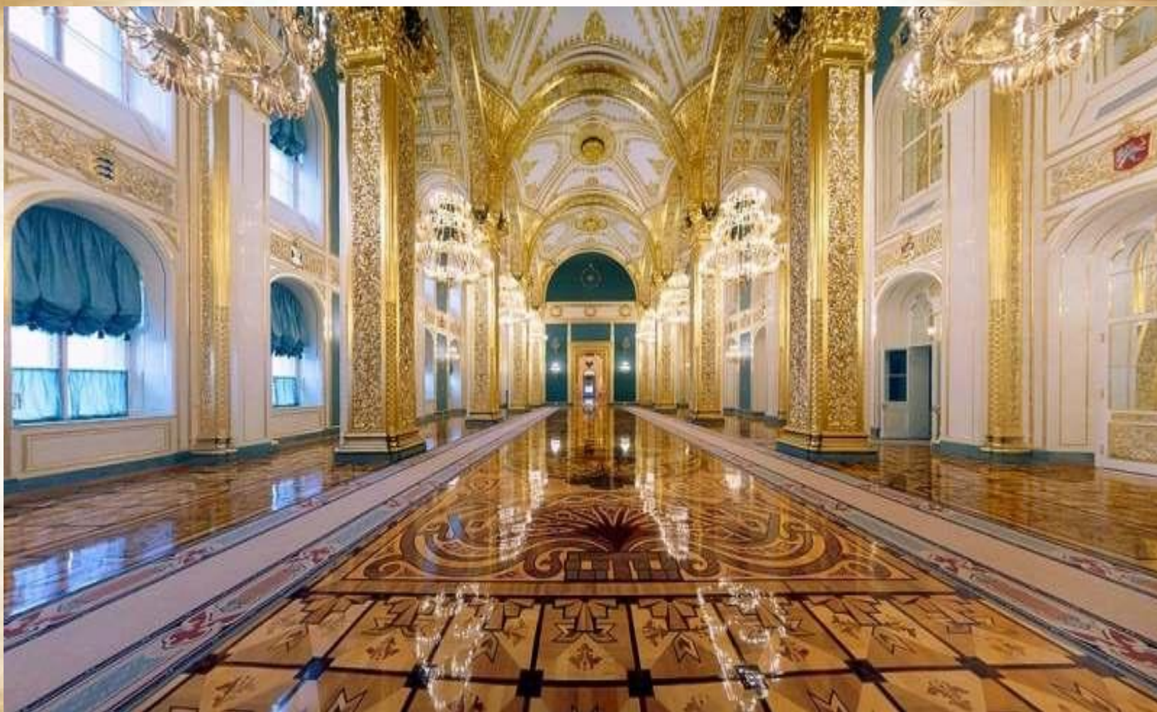
Георгиевский зал дворца.