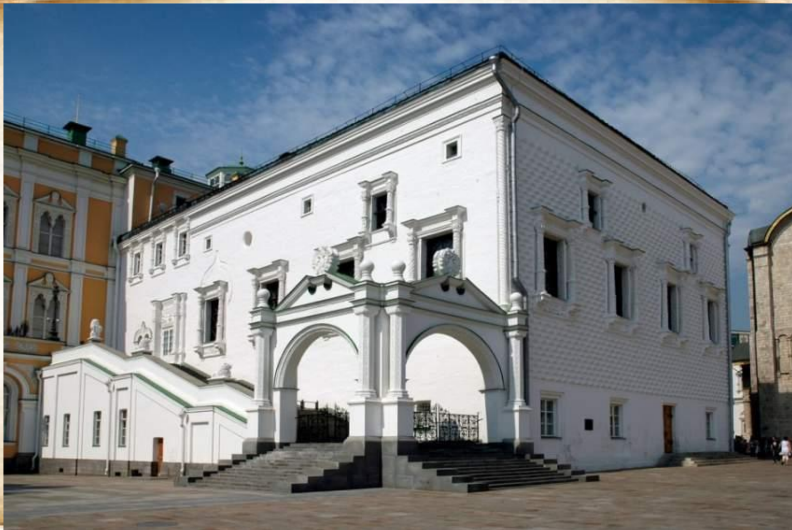
Грановитая палата (1487-1491 годы)