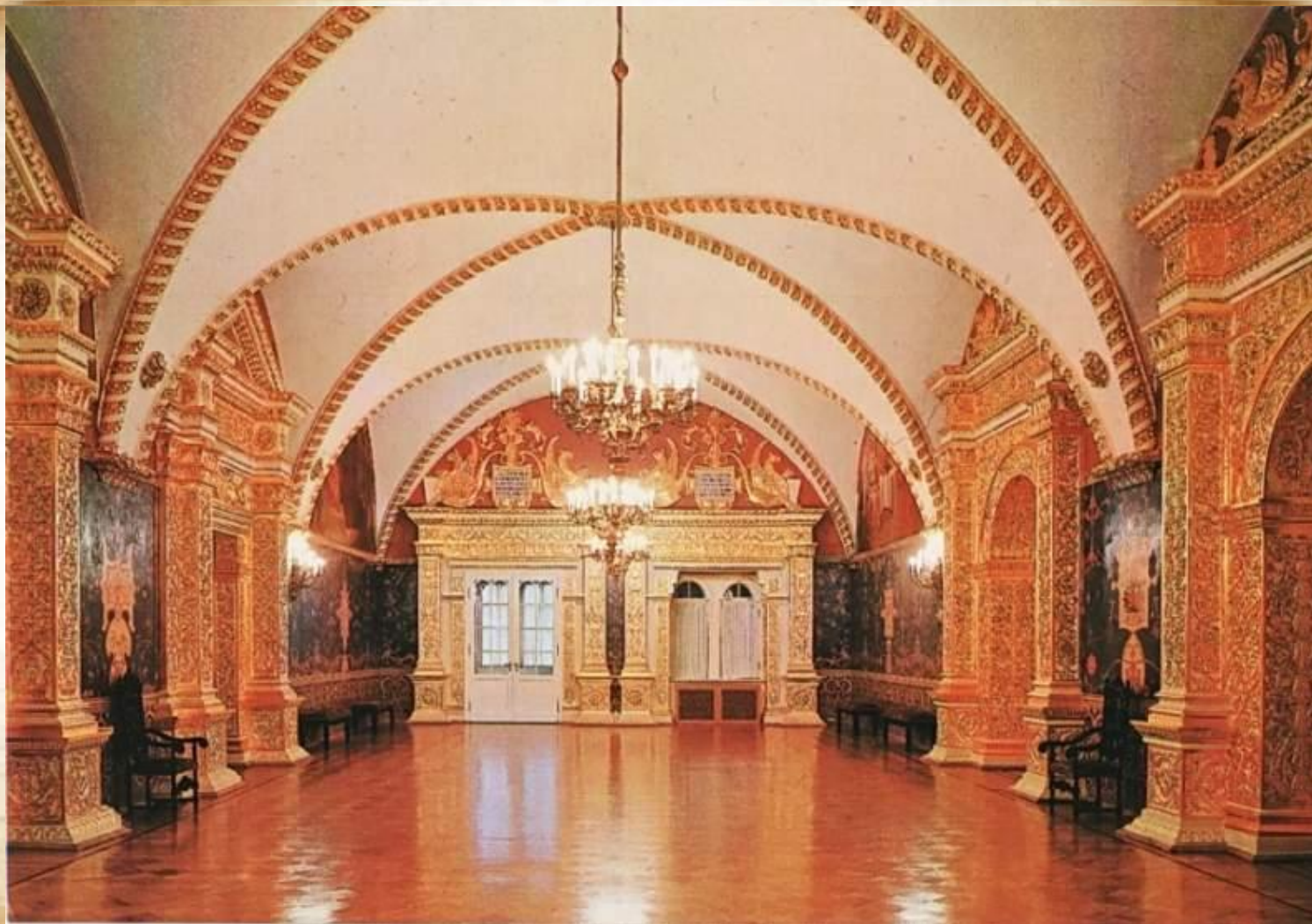
Святые сени Грановитой палаты.