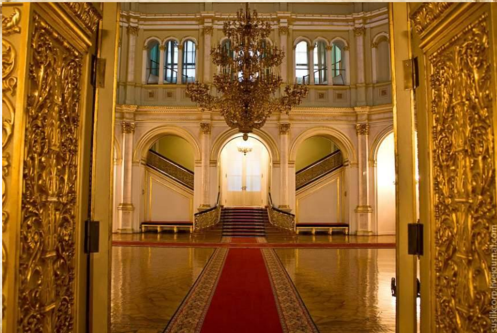
Владимирский зал дворца.