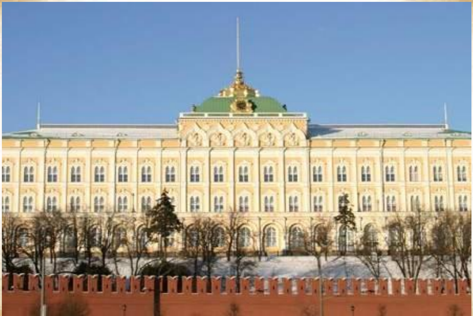
Большой Кремлёвский дворец (1838-1849 годы)