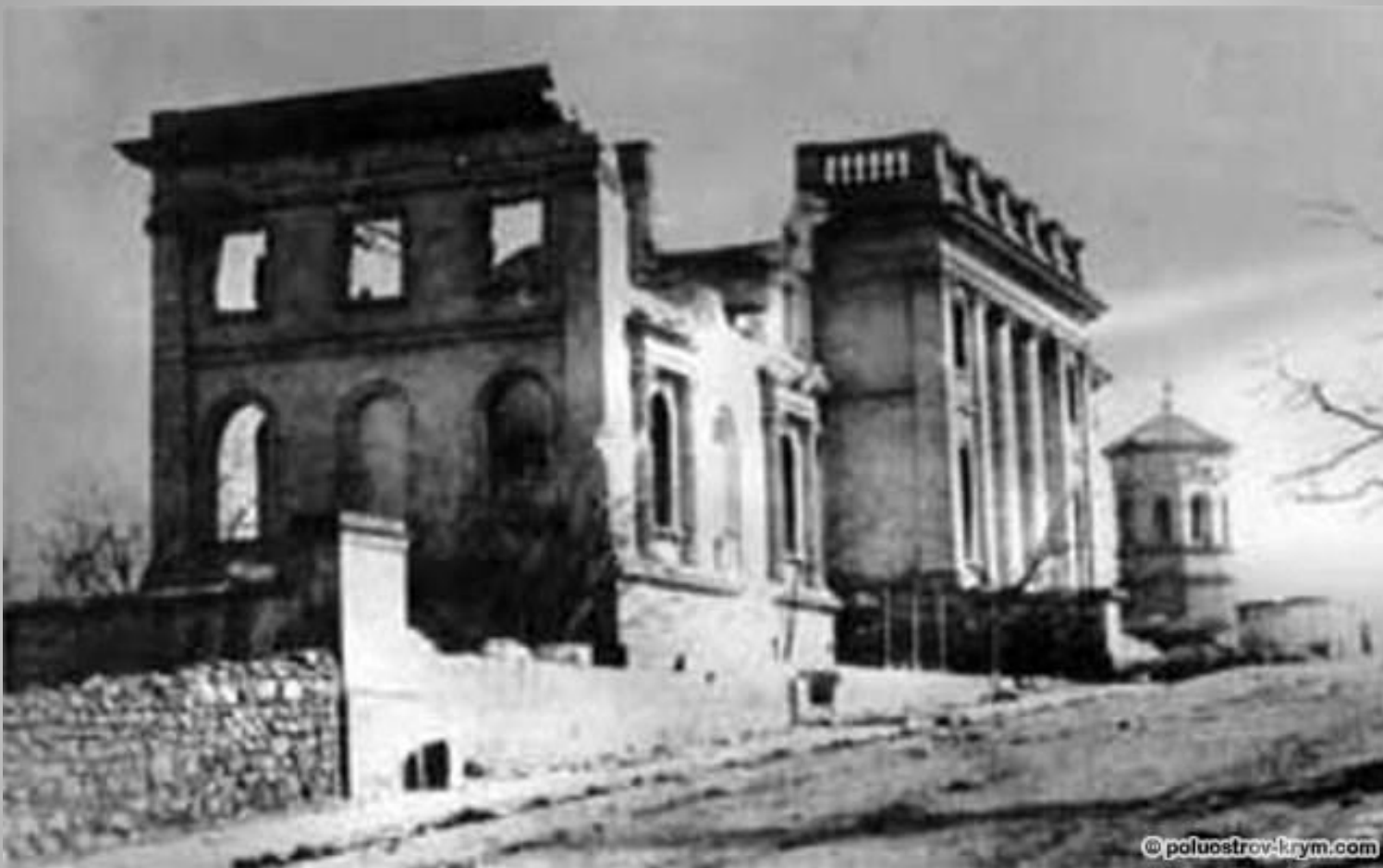
Центральный городской холм. Здание Морской библиотеки, разрушенное в Крымскую войну. Справа на фото — уцелевшая Башня ветров