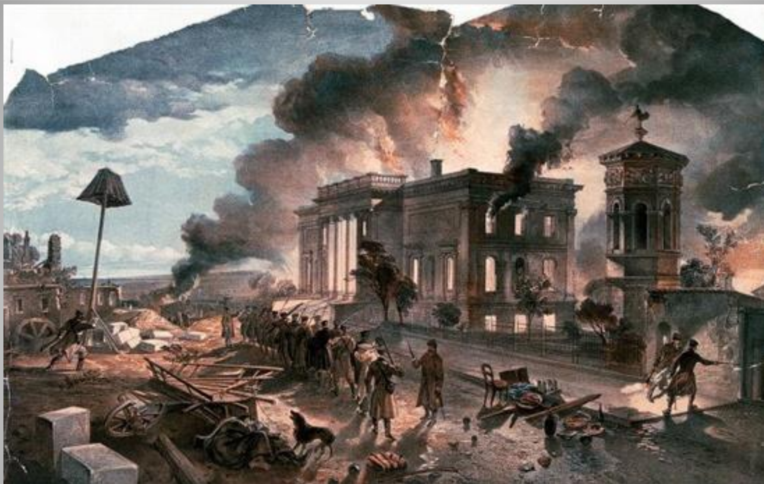
Пожар Морской библиотеки во время осады Севастополя. 1855 год