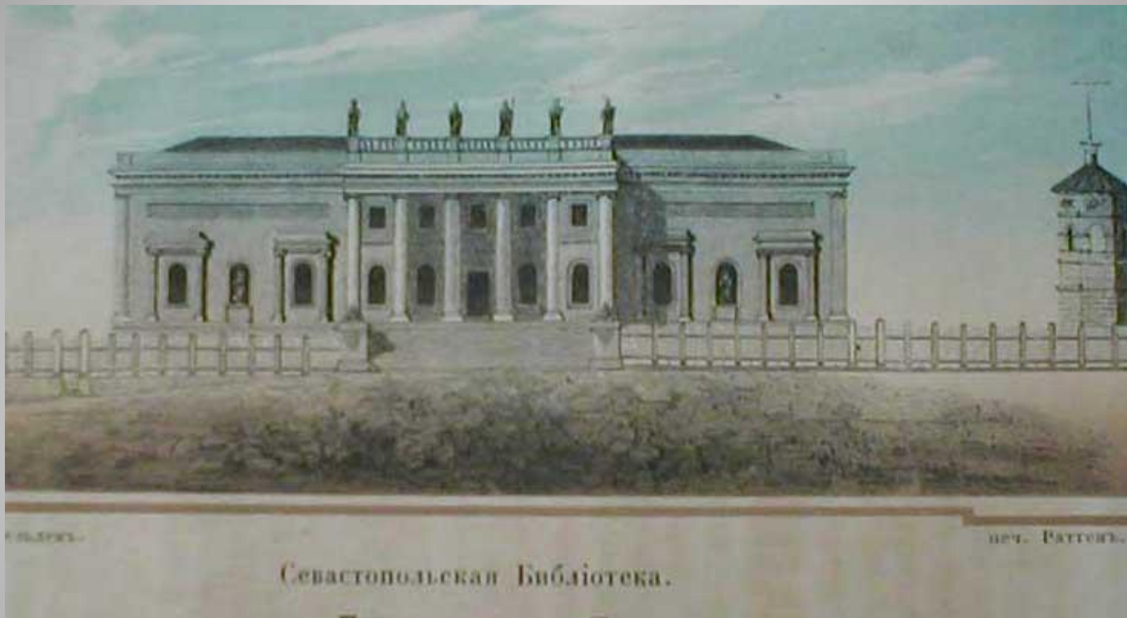
Здание Морской библиотеки, середина 19 века