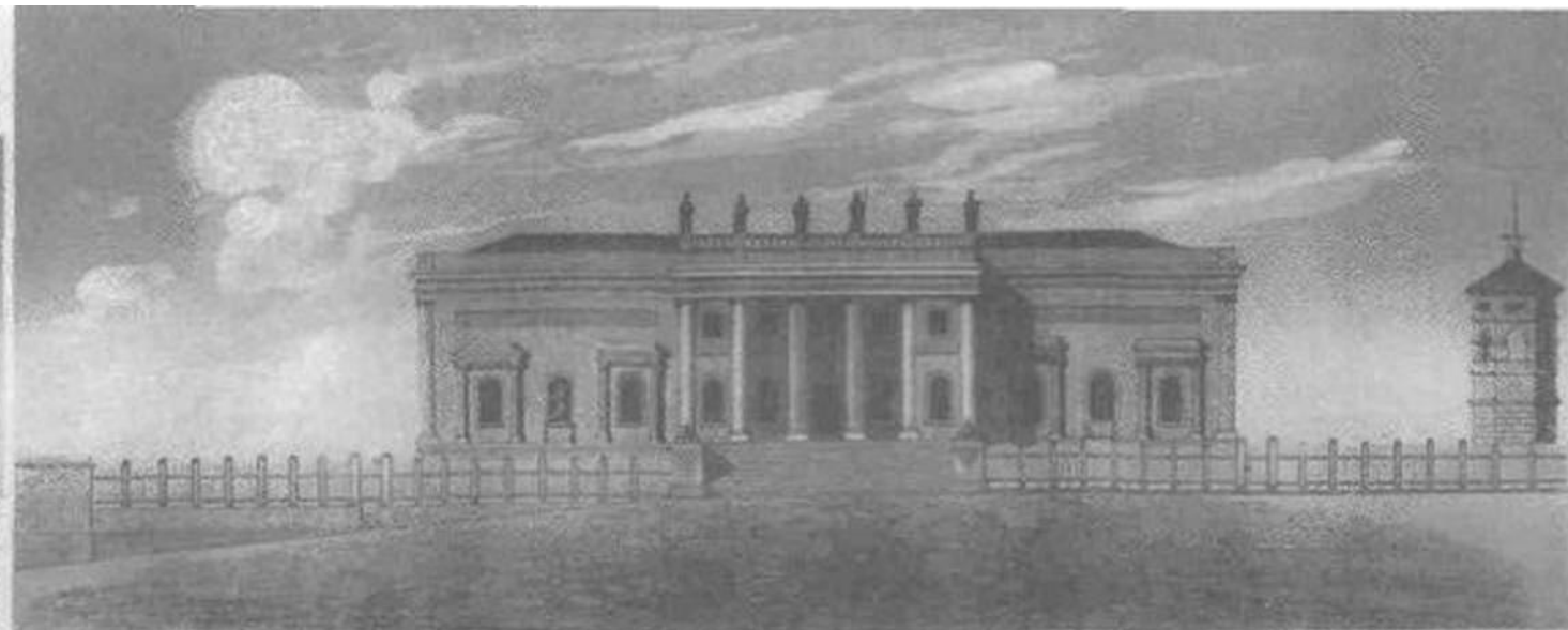
рис. на дгр. Гогенфельденъ.