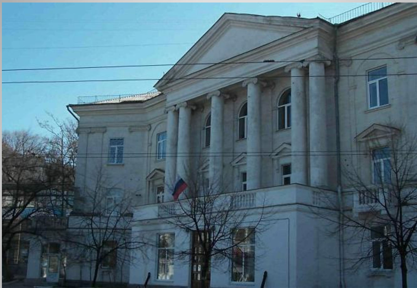
Морская библиотека имени адмирала М.П. Лазарева, современный вид