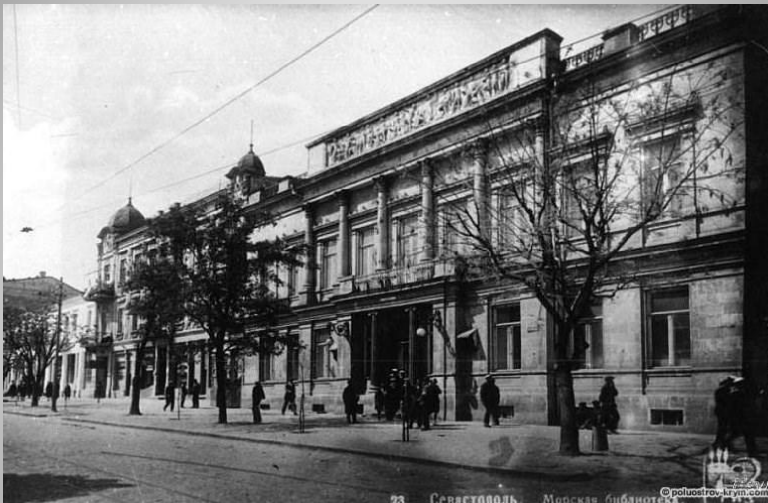
Здание Морской библиотеки на ул. Екатерининской. Начало 20 века