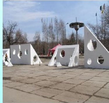
Парк им. Ю. Гагарина в Самаре