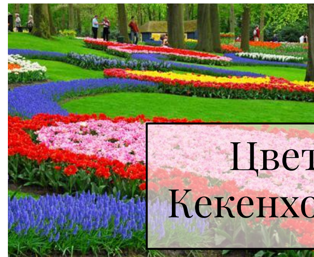
Цветочный парк Кекенхоф, Нидерланды