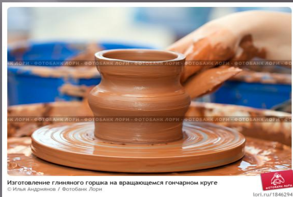
Изготовление глиняного горшка на вращающемся гончарном круге