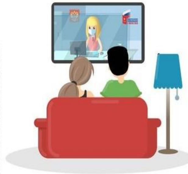
Телевидение и радио