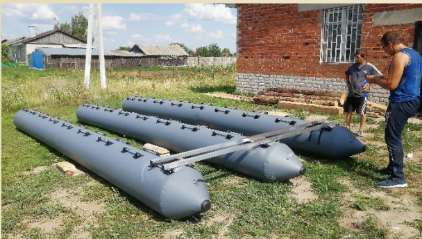
1) ПЛАТФОРМА 3 баллона ПВХ 7x0.6 м, поперечные балки из алюминия