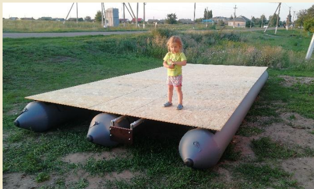
2) НАСТИЛ плита OSB