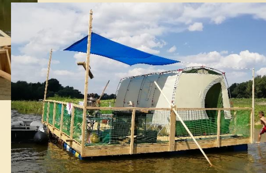
5) ТЕНТ И ОГРАДА брусок 50х50, сетка и тент из полипропилена