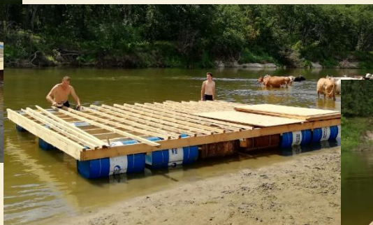
3) ОБРЕШЕТКА брусок 50х50 с шагом 0.4 м