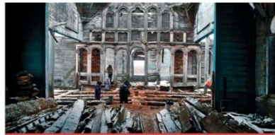
Участники субботних работ разбирали завалы, промаркировали все найденные элементы и сложили их в разобранной под крышей