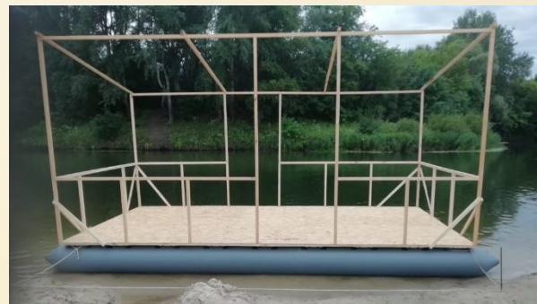
3) ОГРАДА брусок 50x50