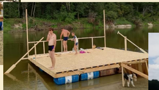
4) НАСТИЛ Плита OSB