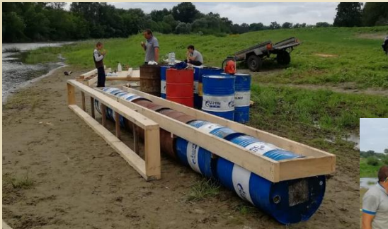
1) ПЛАВУЧИЕ БЛОКИ 3 шт. по 6 бочек 200л, рама из доски 150х50