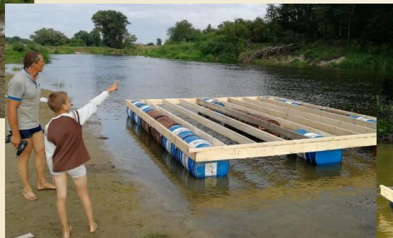
2) ОБЩАЯ РАМА обвязка и лаги с шагом 0.5 м из доски 150х50