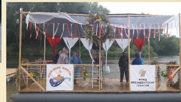
4) ТЕНТ И ДЕКОР тент полипропиленовый, тканый декор, венки, цветы