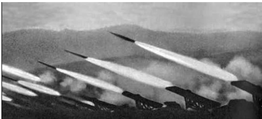
19 ноября 1942 г. залп реактивной артиллерии возвестил о начале контрнаступления под Сталинградом

В оборонительных боях советские войска нанесли значительный урон главной группировке противника и создали условия для перехода в контрнаступление , начавшееся 19 ноября 1942 г.