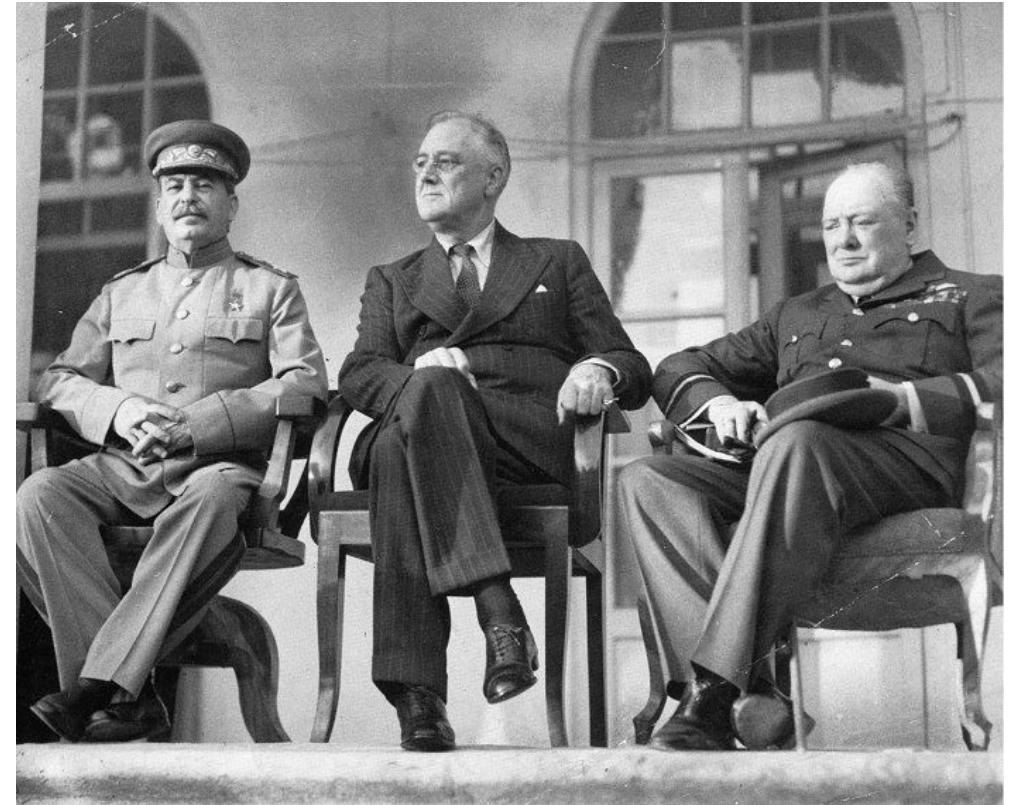
И. В. Сталин, Ф. Д. Рузвельт У. Черчилль в Тегеране

Конференция содействовала укреплению антигитлеровской коалиции и созданию международной системы безопасности после войны.