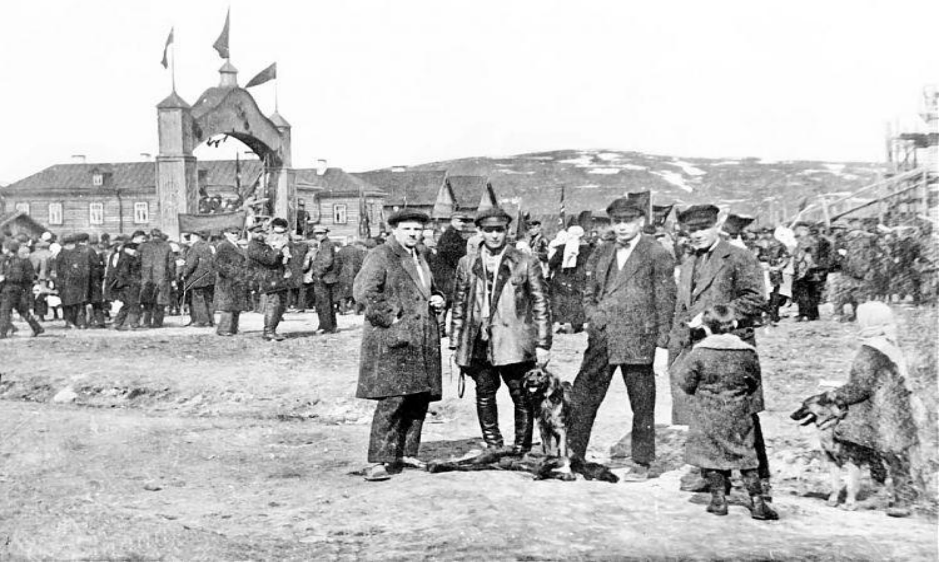
Декоративная арка на площади Свободы. 1920-е гг. Справа - строящийся памятник.