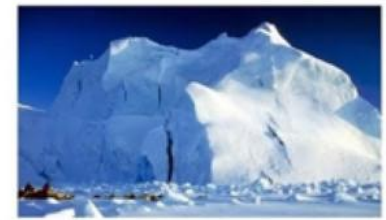
ЗОНА АРКТИЧЕСКИХ ПУСТЫНЬ