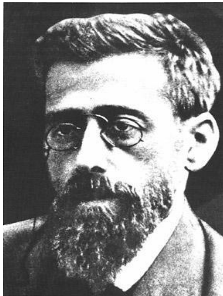
■ Ю. О. Мартов