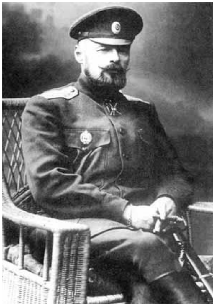
■ В.М. Пуришкевич