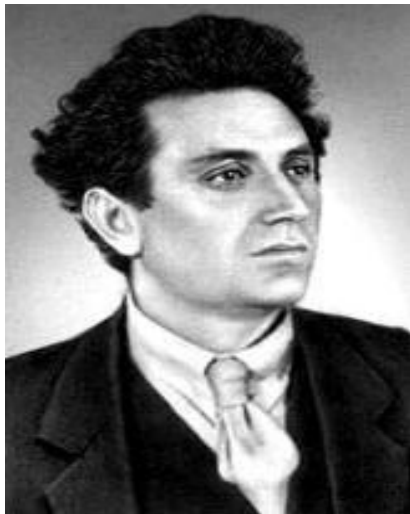
■ Г.Е Зиновьев