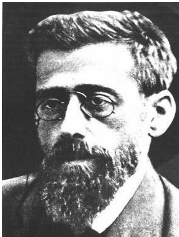
■ Ю. О. Мартов