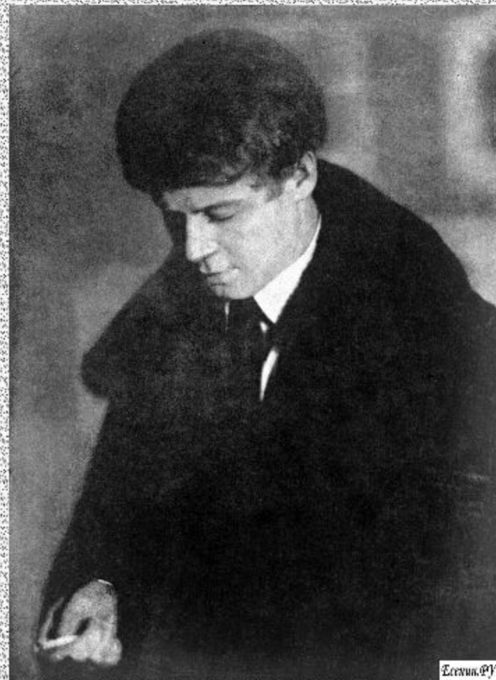
Сергей Есенин в 1924 году

В 1924-25 Есенин пишет такие известные стихотворения, как "Русь уходящая", "Письмо к женщине", "Письмо матери", "Стансы"; цикл "Персидские мотивы".