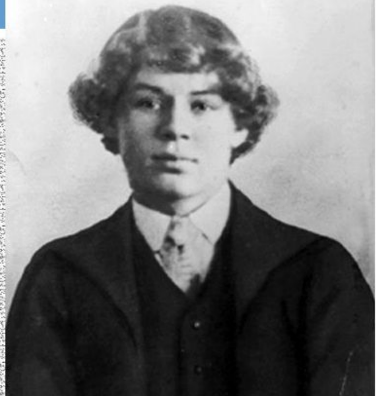
Есенин, 1914 год, Москва

В Семнадцать лет уехал в Москву, где работал корректором в типографии, продолжал писать стихи. В 1912 году поступил в Народный университет А.Шанявского на историко-философское отделение, где проучился полтора года.