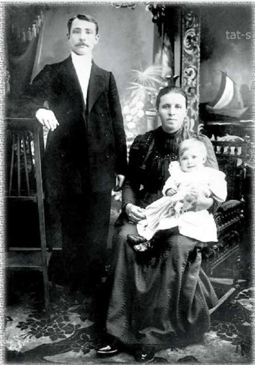
Родители Сергея Есенина.