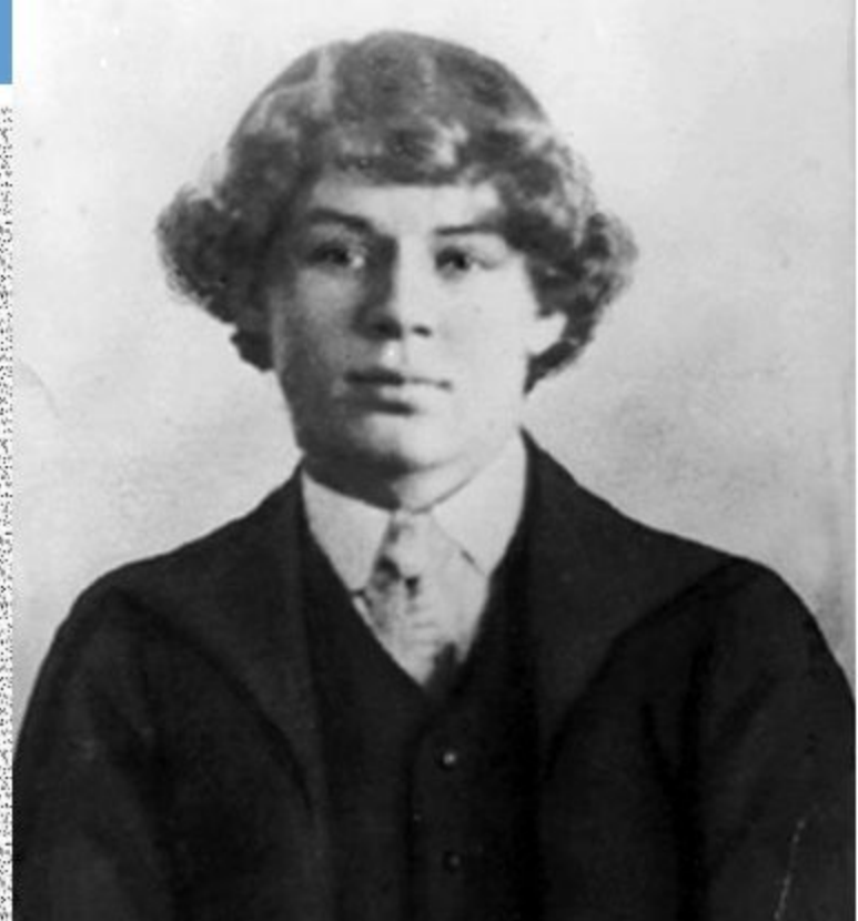
Есенин, 1914 год, Москва

В Семнадцать лет уехал в Москву, где работал корректором в типографии, продолжал писать стихи. В 1912 году поступил в Народный университет А.Шанявского на историко-философское отделение, где проучился полтора года.