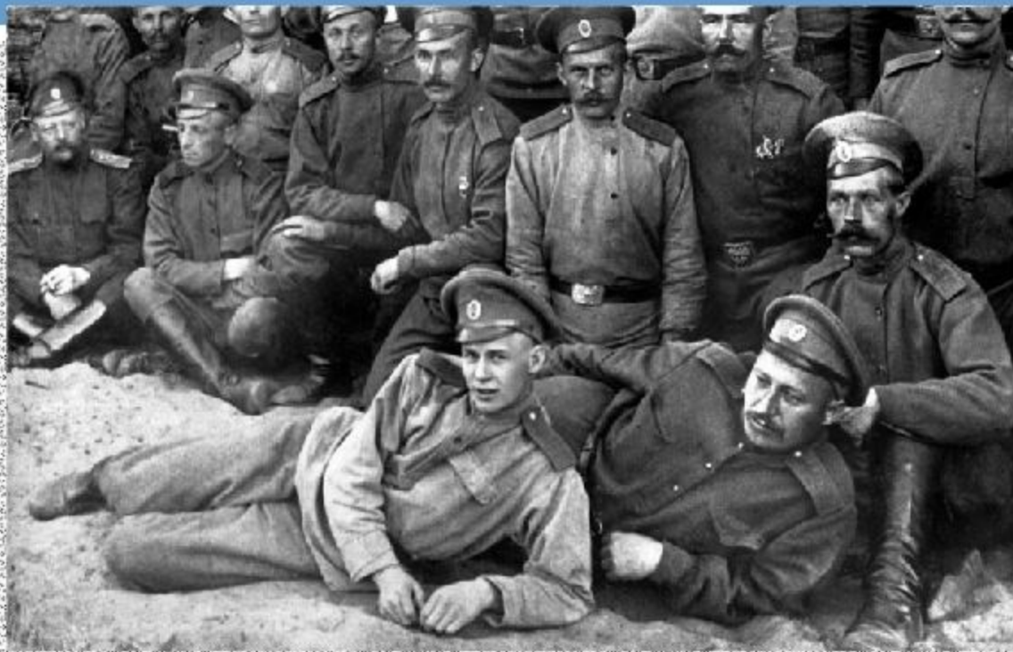
С. А. Есенин среди персонала полевого Царскосельского военно-санитарного поезда № 143. 1916 г., июнь. Черновцы.

В январе 1916 года Есенина призвали на военную службу. Весной молодого поэта приглашают читать стихи императрице, что в будущем помогает ему избежать фронта.