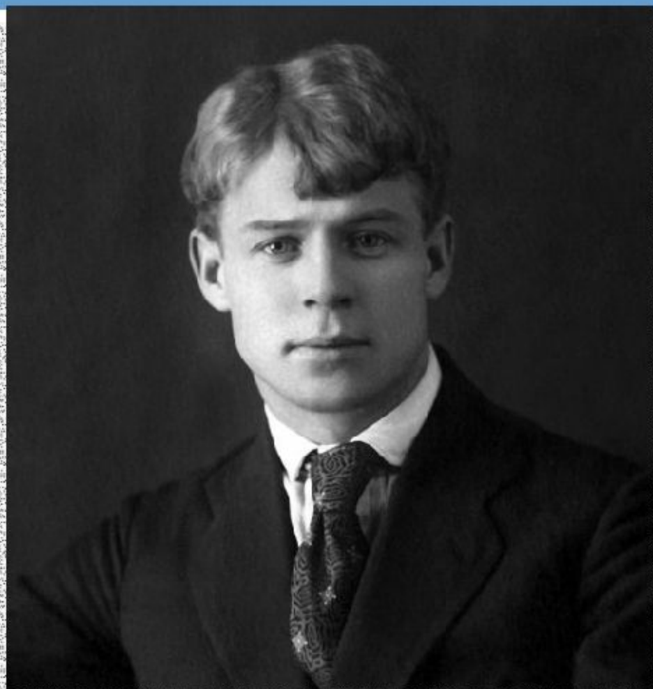
Сергей Есенин, конец 1921 - начало 1922 года

В 1921 году поэт отправился в путешествие по Средней Азии, посетил Урал и Оренбуржье.