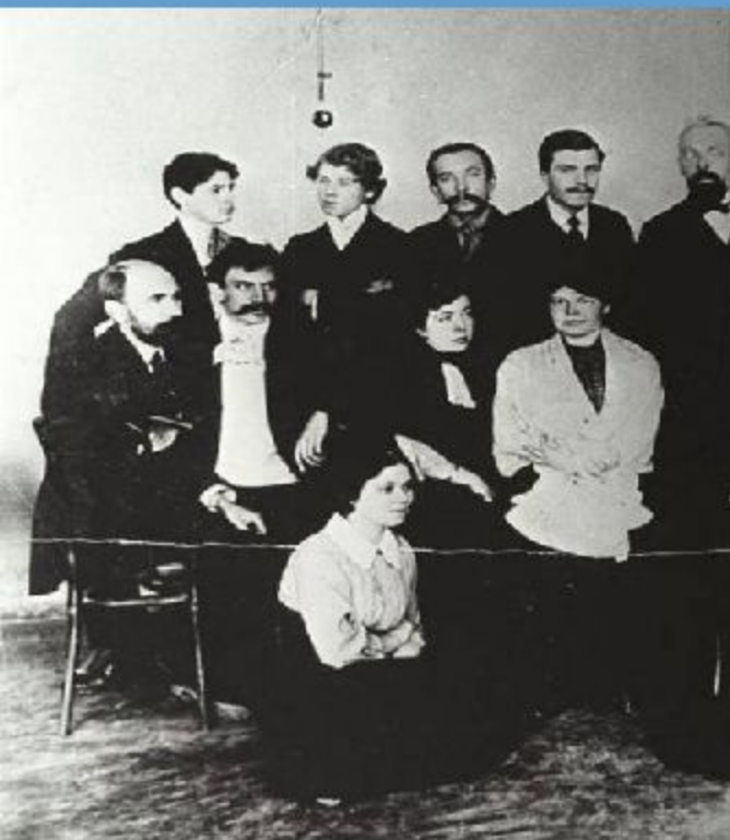
Сергей Есенин с работниками типографии, 1914 год

В Семнадцать лет уехал в Москву, где работал корректором в типографии, продолжал писать стихи. В 1912 году поступил в Народный университет А.Шанявского на историко-философское отделение, где проучился полтора года.