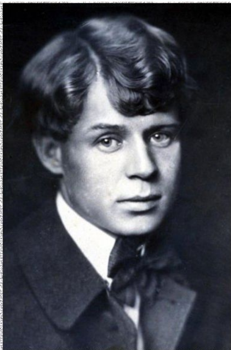
Сергей Есенин в 1918 году

Уже в апреле 1918 года Есенин перебирается в Москву, которая к тому времени стала литературным центром России, и примыкает к имажинистам.