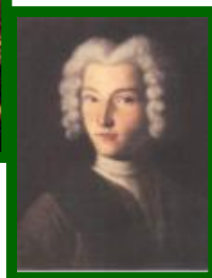
Петр II 1727-1730