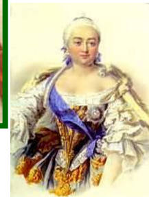
Елизавета Петровна 1741-1761