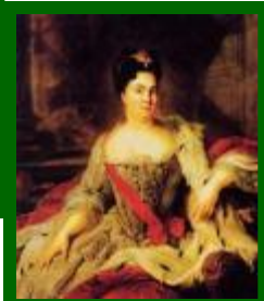
Екатери на I 1725-1727