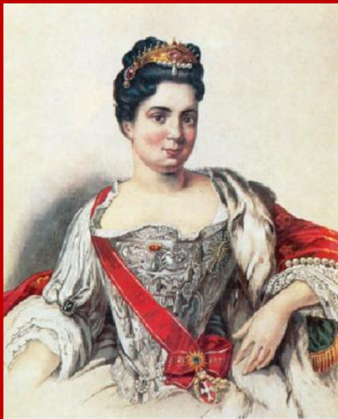
Екатерина I Алексеевна. (1684-1727)