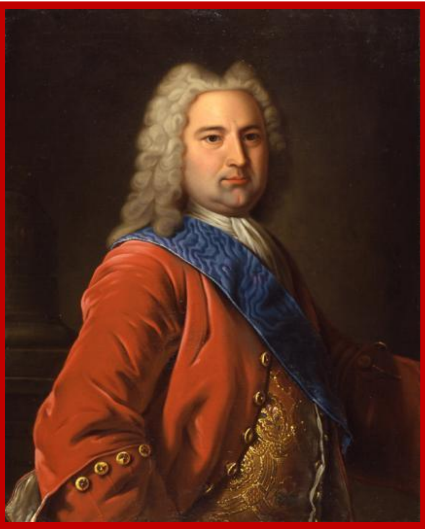
Эрнст Бирон – фаворит Анны Иоанновны