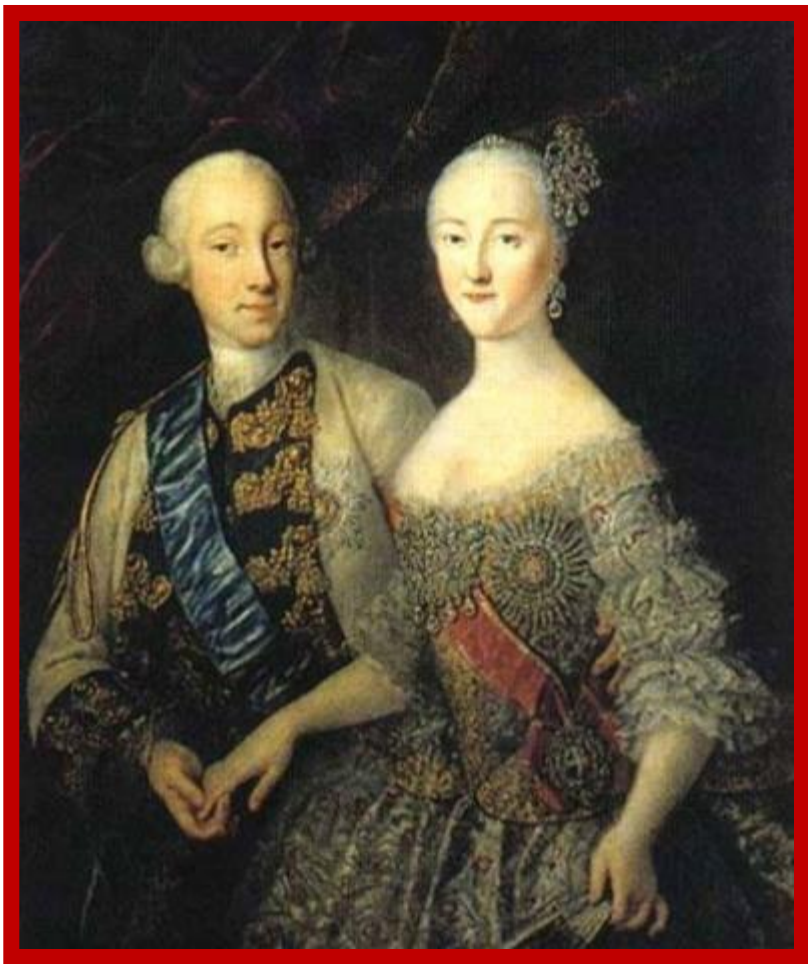
Петр Федорович, великий князь, Екатерина Алексеевна, великая княгиня.