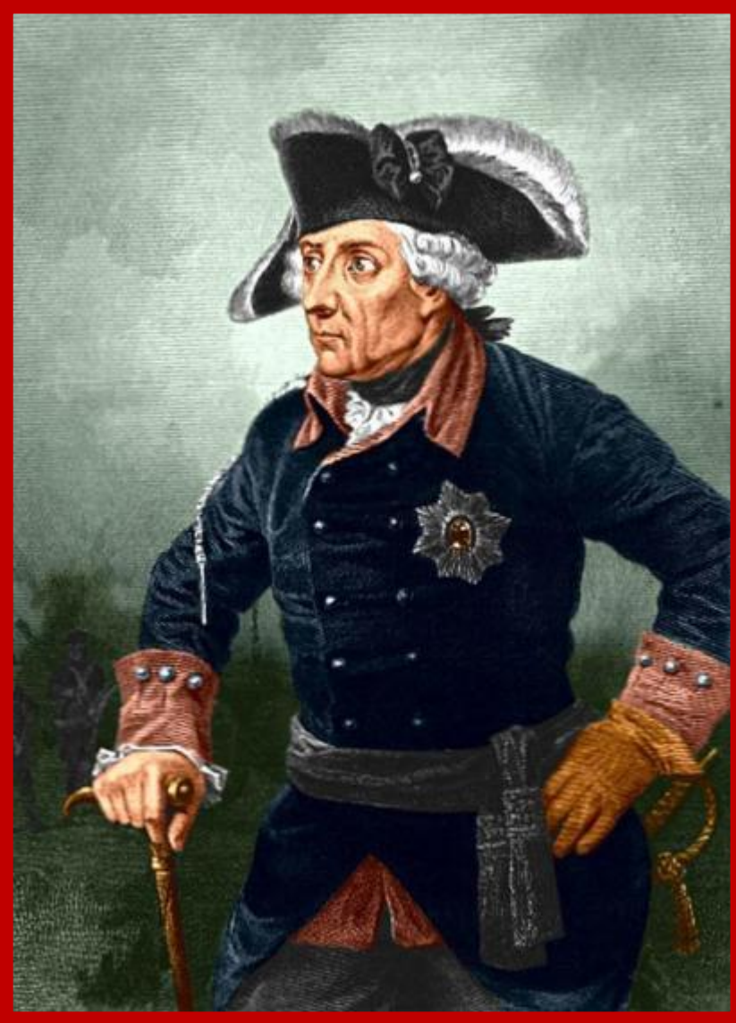
Прусский король Фридрих II

24 апреля 1762 года - Петербургский мирный договор между Россией и Пруссией, заключённый Петром III, поклонником Фридриха II Прусского. • Россия выходила из Семилетней войны и добровольно возвращала Пруссии территорию, занятую русскими войсками, включая Восточную Пруссию.