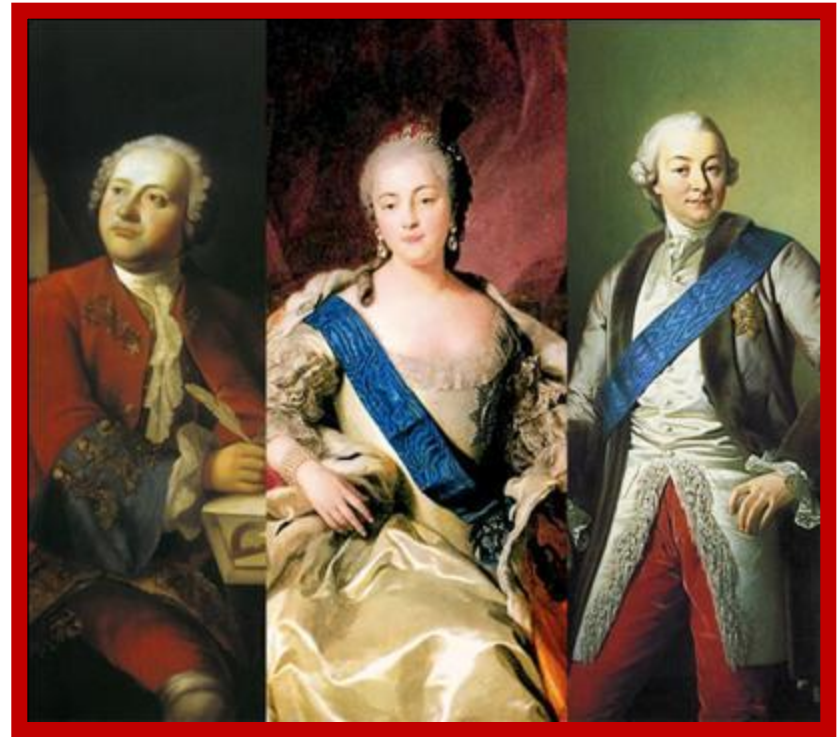
Михаил Васильевич Ломоносов, императрица Елизавета Петровна, Иван Иванович Шувалов.