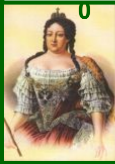
Анна Иоаннов на 1730-1740