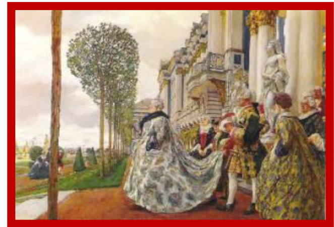
Императрица Елизавета Петровна в Царском Селе Е. Е. Лансере