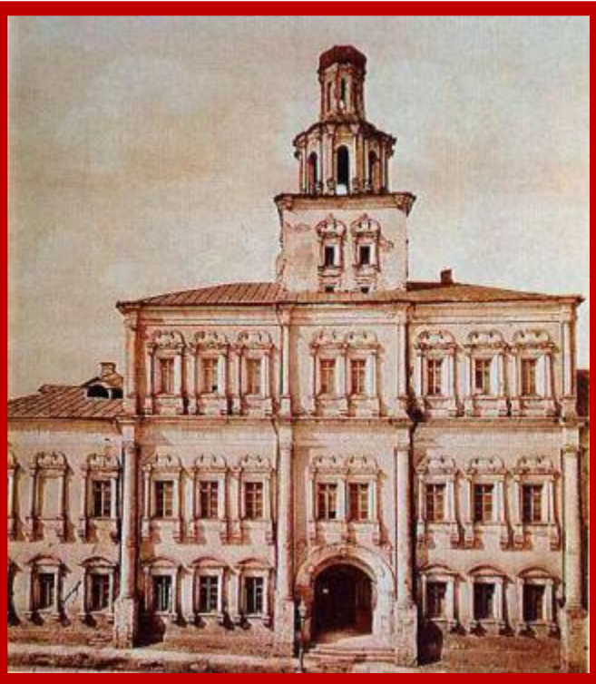
Первое здание Московского университета