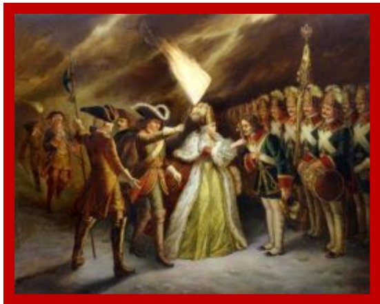
Филипп М.Р. Присяга преображенцев дочери Петра Великого.