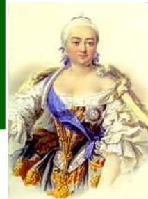
Елизавета Петровна 1741-1761