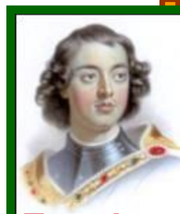
Петр I 1682-1725

Период в истории России с 1725 по 1762 гг.