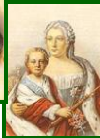
Иван VI Антонович и Анна Леопольдовна 1740-1741