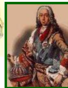
Петр III 1761-1762