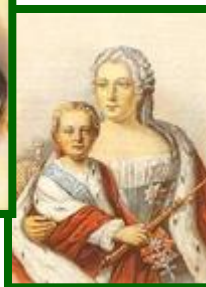
Иван VI Антонович и Анна Леопольдовна 1740-1741