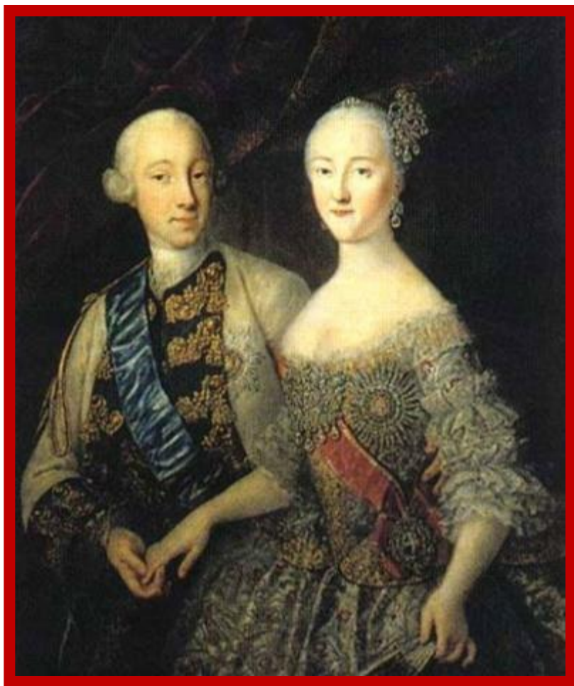
Петр Федорович, великий князь, Екатерина Алексеевна, великая княгиня.