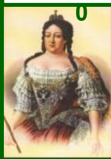
Анна Иоаннов на 1730-1740