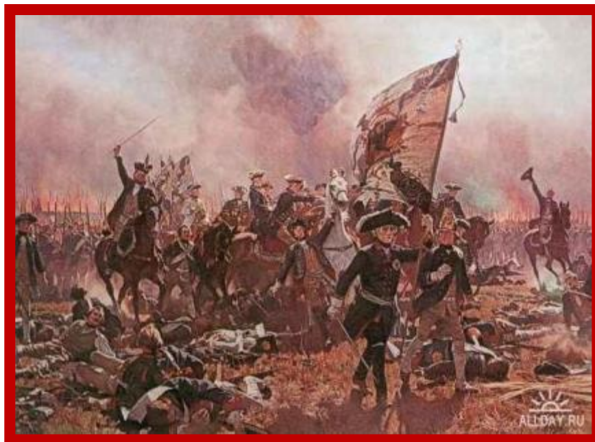
Сражение у Цорндорфа

1761 г. – смерть Елизаветы Петровны. Петр III заключил с Фридрихом II союз против своих бывших союзников и вернул Пруссии все завоевания.