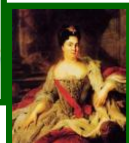
Екатери на I 1725-1727