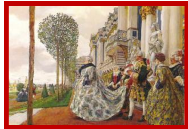
Императрица Елизавета Петровна в Царском Селе Е. Е. Лансере