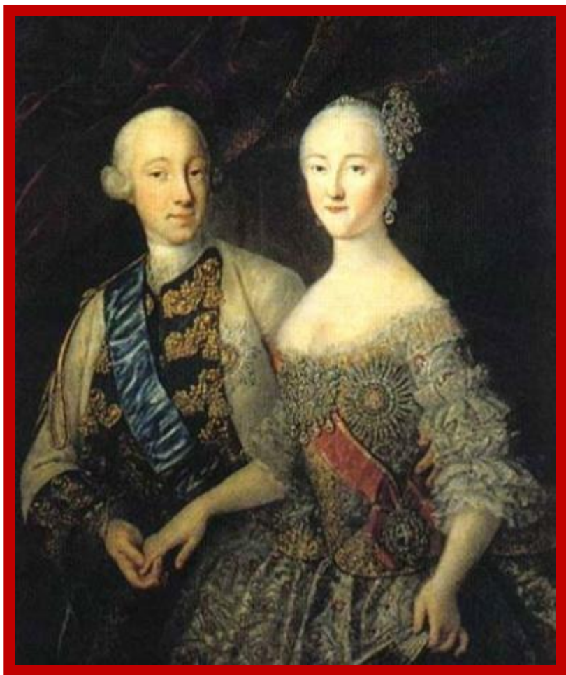
Петр Федорович, великий князь, Екатерина Алексеевна, великая княгиня.