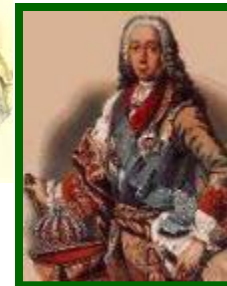
Петр III 1761-1762