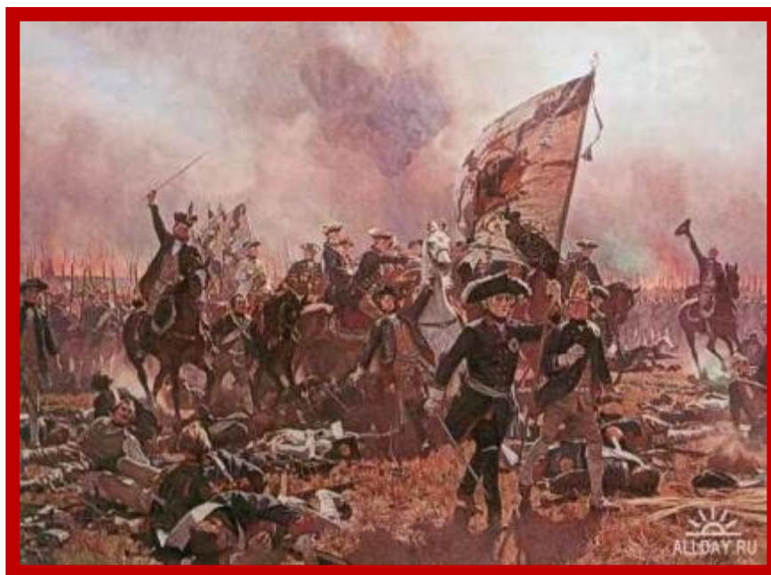
Сражение у Цорндорфа

1761 г. – смерть Елизаветы Петровны. Петр III заключил с Фридрихом II союз против своих бывших союзников и вернул Пруссии все завоевания.