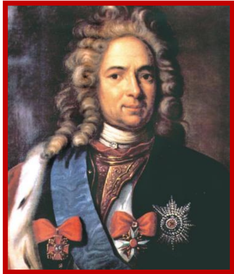
Александр Данилович Меншиков