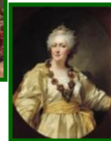
Екатерина II 1762-1796