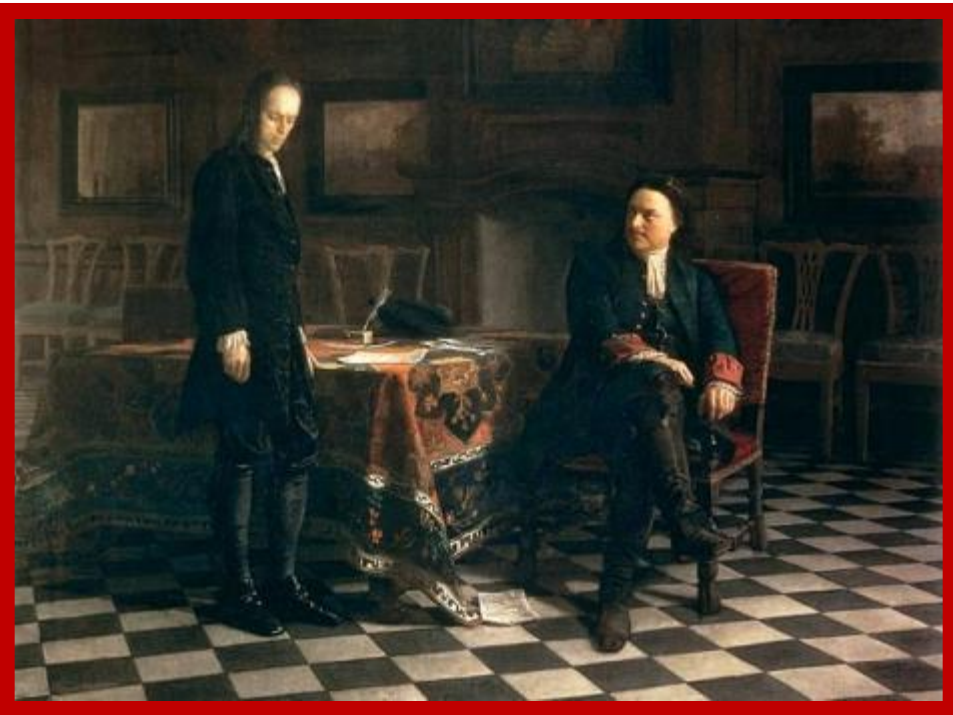
Николай Ге. Петр I допрашивает царевича Алексея Петровича в Петергофе