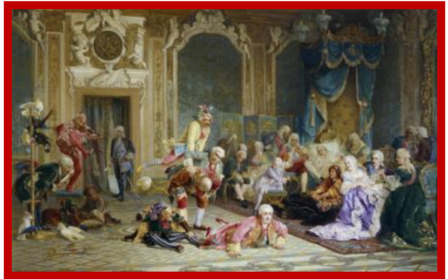
Якоби Валерий Иванович. Шуты при дворе императрицы Анны Иоанновны.

1730-1740 гг. - правление Анны Иоанновны Племянница Петра I, вышедшая замуж за герцога Курляндского, прозвище «Кровавая», «Митавская затворница».