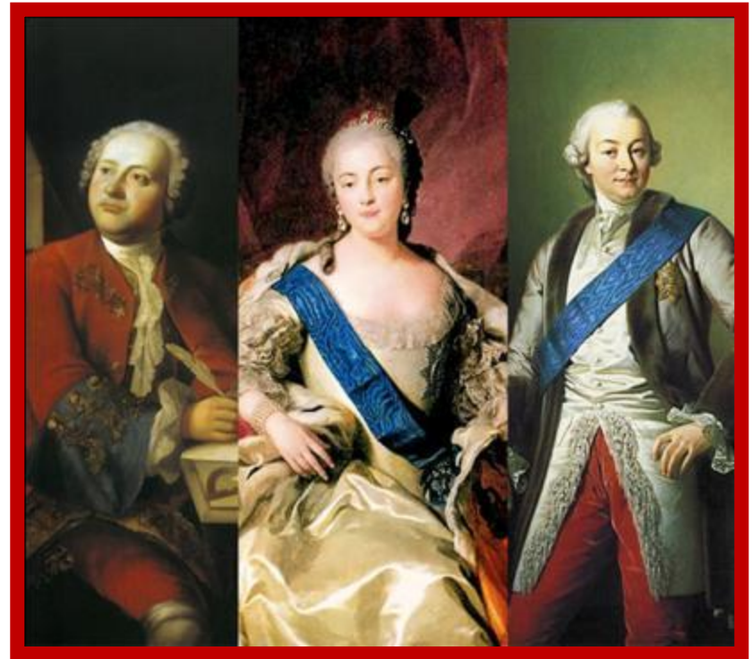
Михаил Васильевич Ломоносов, императрица Елизавета Петровна, Иван Иванович Шувалов.