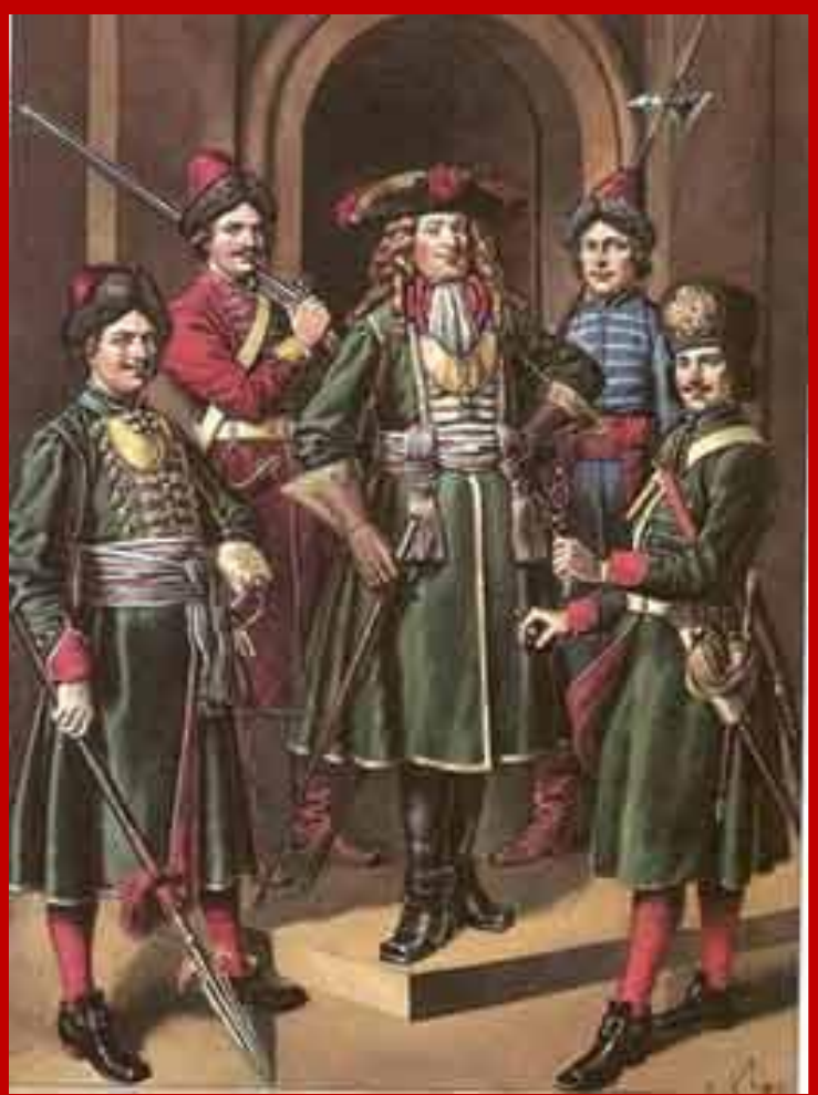
С. Летин "Служилое платье от Петра Великого. Гвардейские мундиры