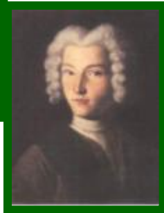
Петр II 1727-1730