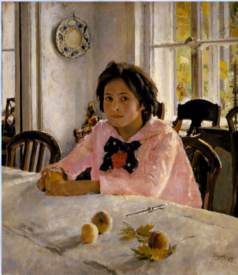
В. А. Серов «Девочка с персиками»

На другой день поутру я только что стал одеваться, как дверь отворилась и ко мне вошел молодой офицер невысокого роста, с лицом смуглым и отменно некрасивым, но чрезвычайно живым (А. С. Пушкин «Капитанская дочка»)