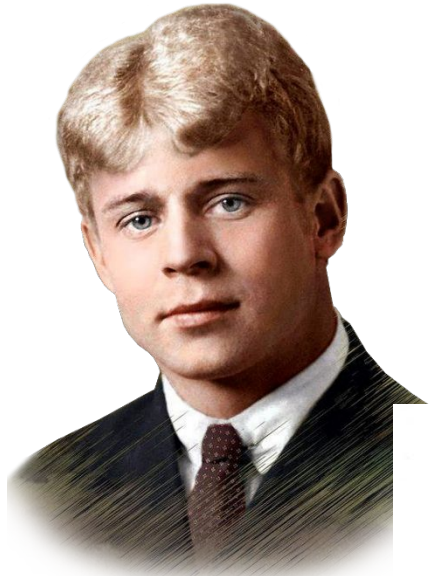
Сергей Александрович ЕСЕНИН 1895 - 1925