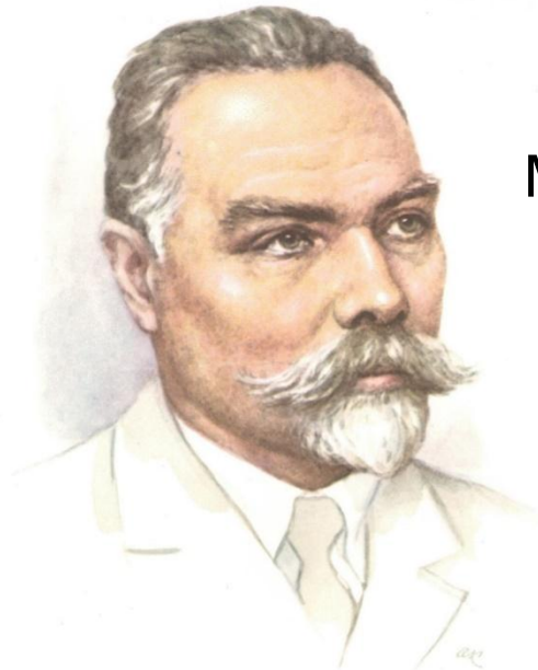
Валерий Яковлевич БРЮСОВ 1873 - 1902