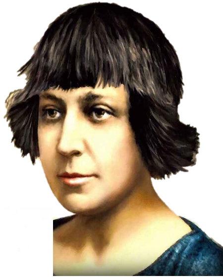
Марина Ивановна ЦВЕТАЕ 1892 - 1941 ВА