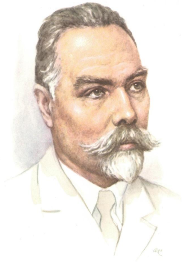
Валерий Яковлевич Брюсов (1873 – 1924)