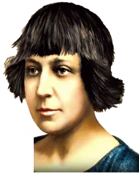
Марина Ивановна ЦВЕТАЕ 1892 - 1941 ВА