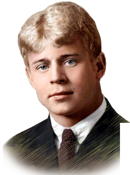
Сергей Александрович ЕСЕНИН 1895 - 1925