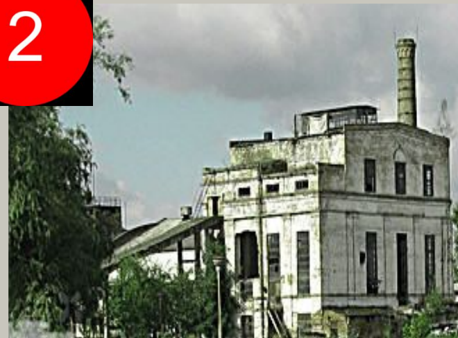
Кохавінська паперова фабрика