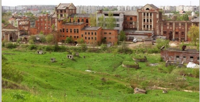
Калуський калійний завод «Оріана»