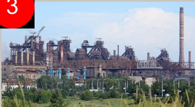
Металургійний комбінат «Азовсталь»