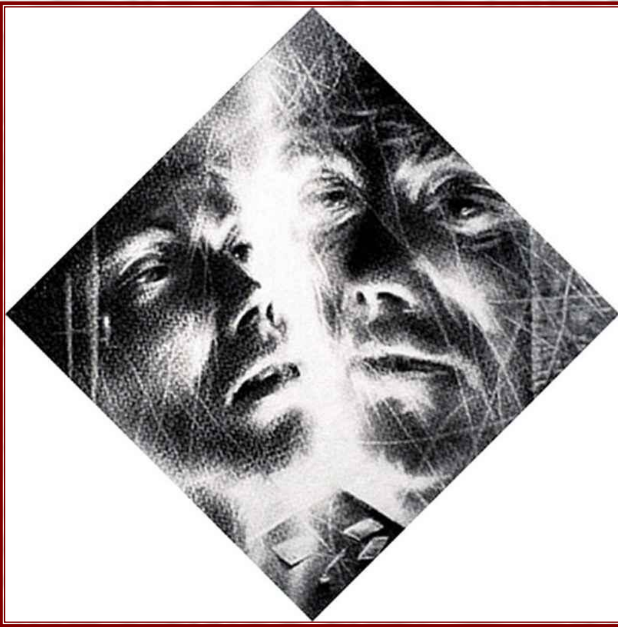
Раскольников и Порфирий Петрович