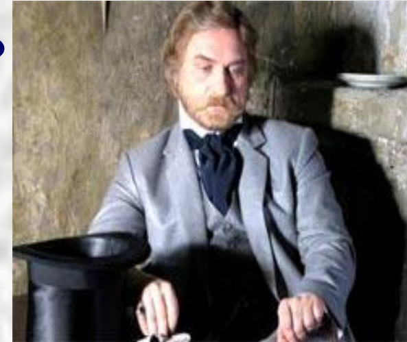
Аркадий Иванович Свидригайлов