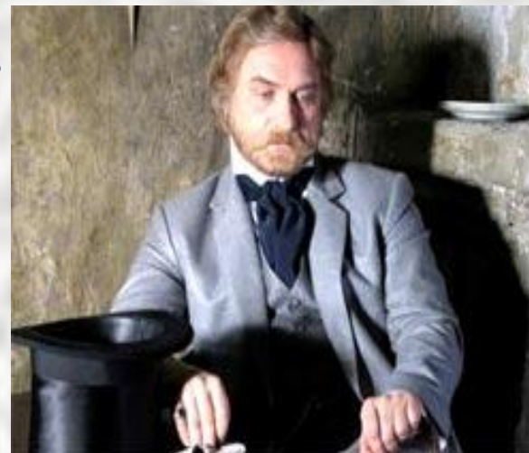
Аркадий Иванович Свидригайлов