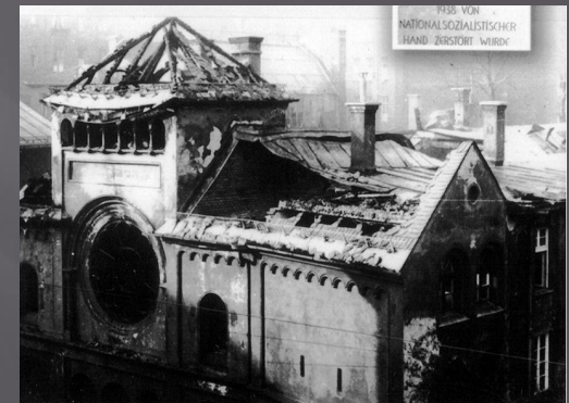
Мюнхенская синагога «Охель Яков», разгромленная во время «Хрустальной ночи»