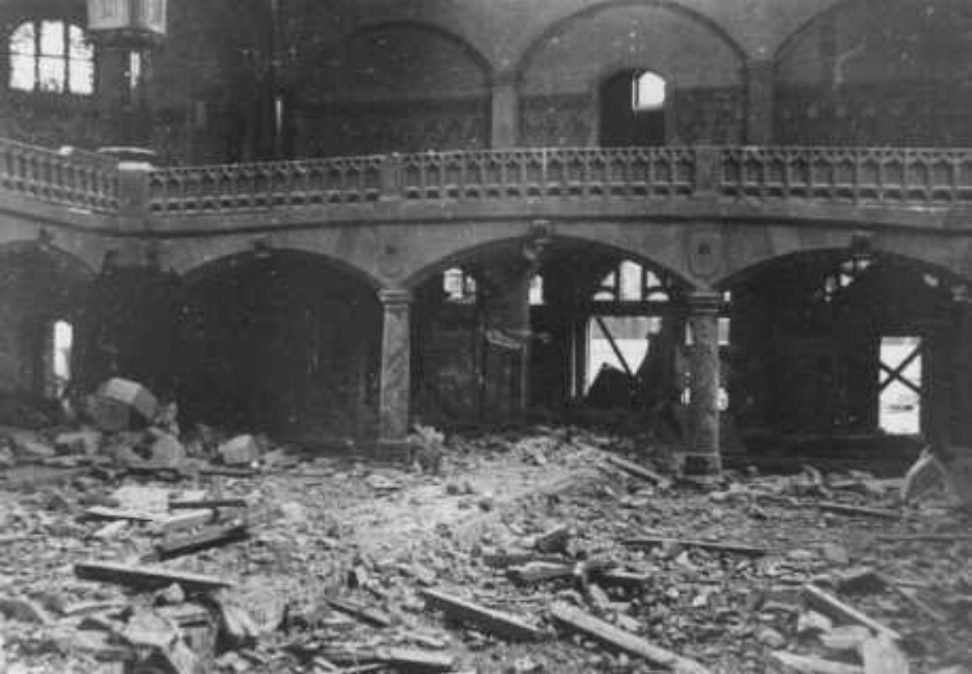
Синагога, разрушенная во время Хрустальной ночи