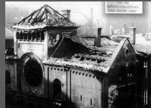
Мюнхенская синагога «Охель Яков», разгромленная во время «Хрустальной ночи»