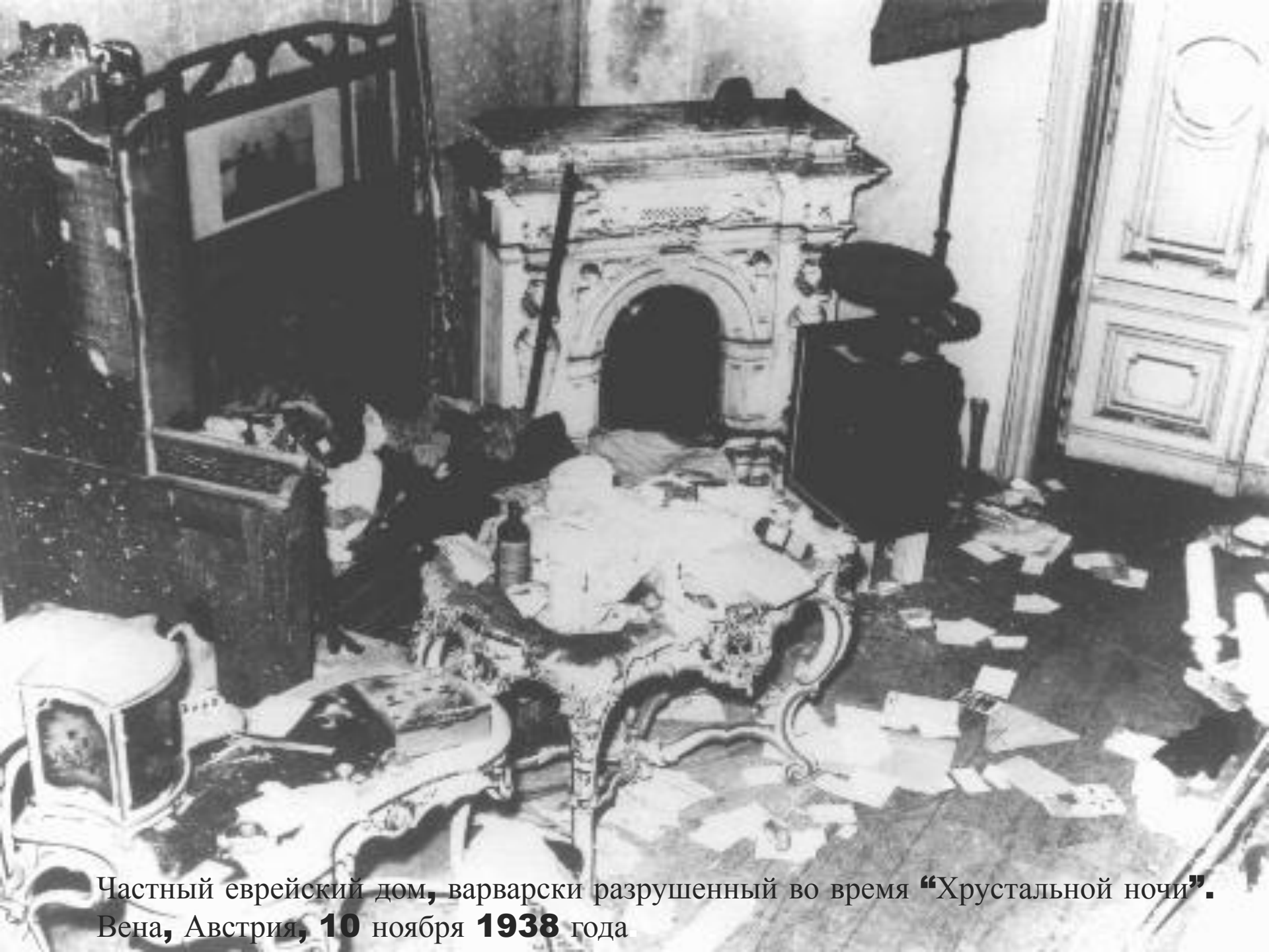
Частный еврейский дом, варварски разрушенный во время “Хрустальной ночи”. Вена, Австрия, 10 ноября 1938 года