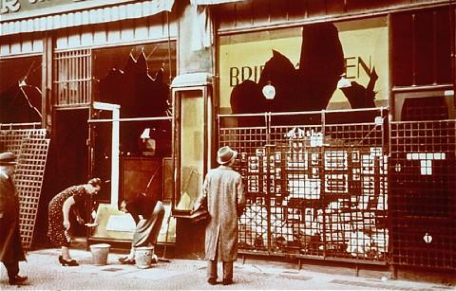
Витрины магазинов, принадлежавших евреям и поврежденных во время погрома “Хрустальной ночи”. Берлин, Германия, 10 ноября 1938 года.