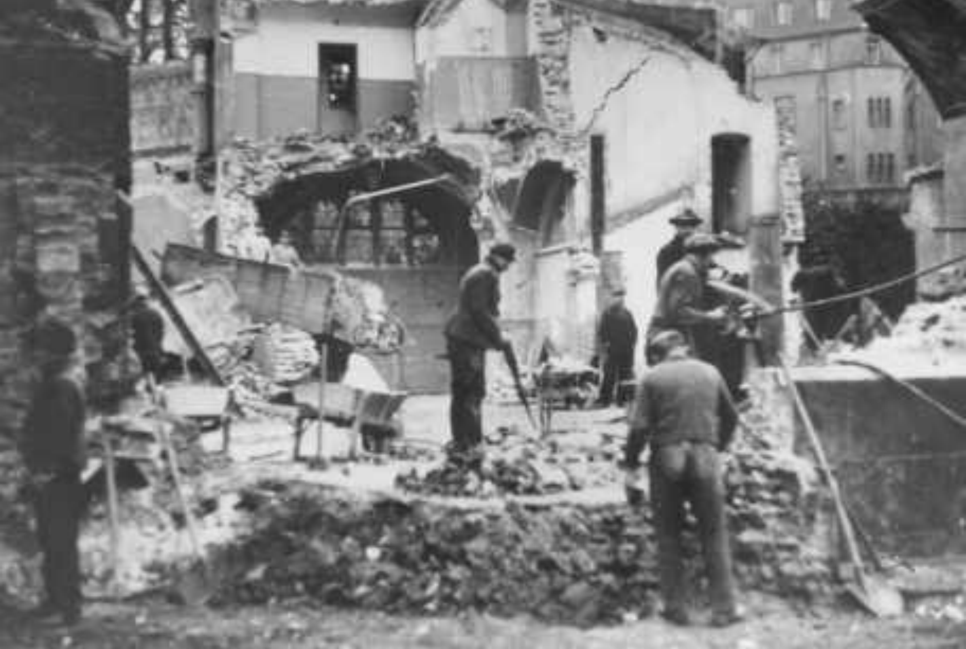
Разорение дортмундской синагоги во время “Хрустальной ночи”. Германия, ноябрь 1938 г