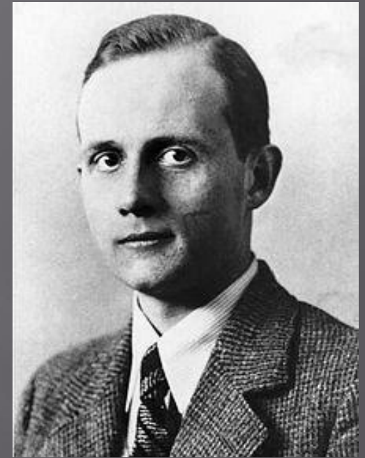
Эрнст фом Рата

Это убийство немецкие власти использовали как повод для организации массовых еврейских погромов в Германии и Австрии. В Германии была немедленно организована мощная пропагандистская кампания.