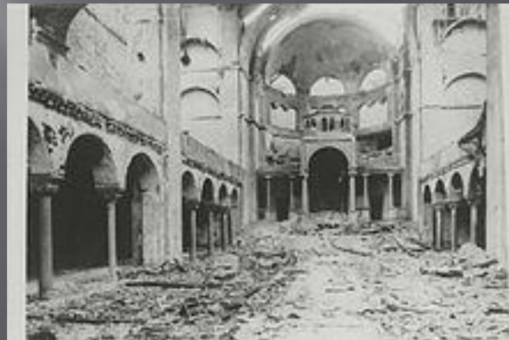
Интерьер берлинской синагоги на Фазаненштрассе после погромов

В Берлине погромщики в гражданской одежде сожгли 9 из 12 синагог, при этом пожарные, как отмечается, не принимали участия в тушении пожаров. В австрийской Вене пострадало 42 синагоги.