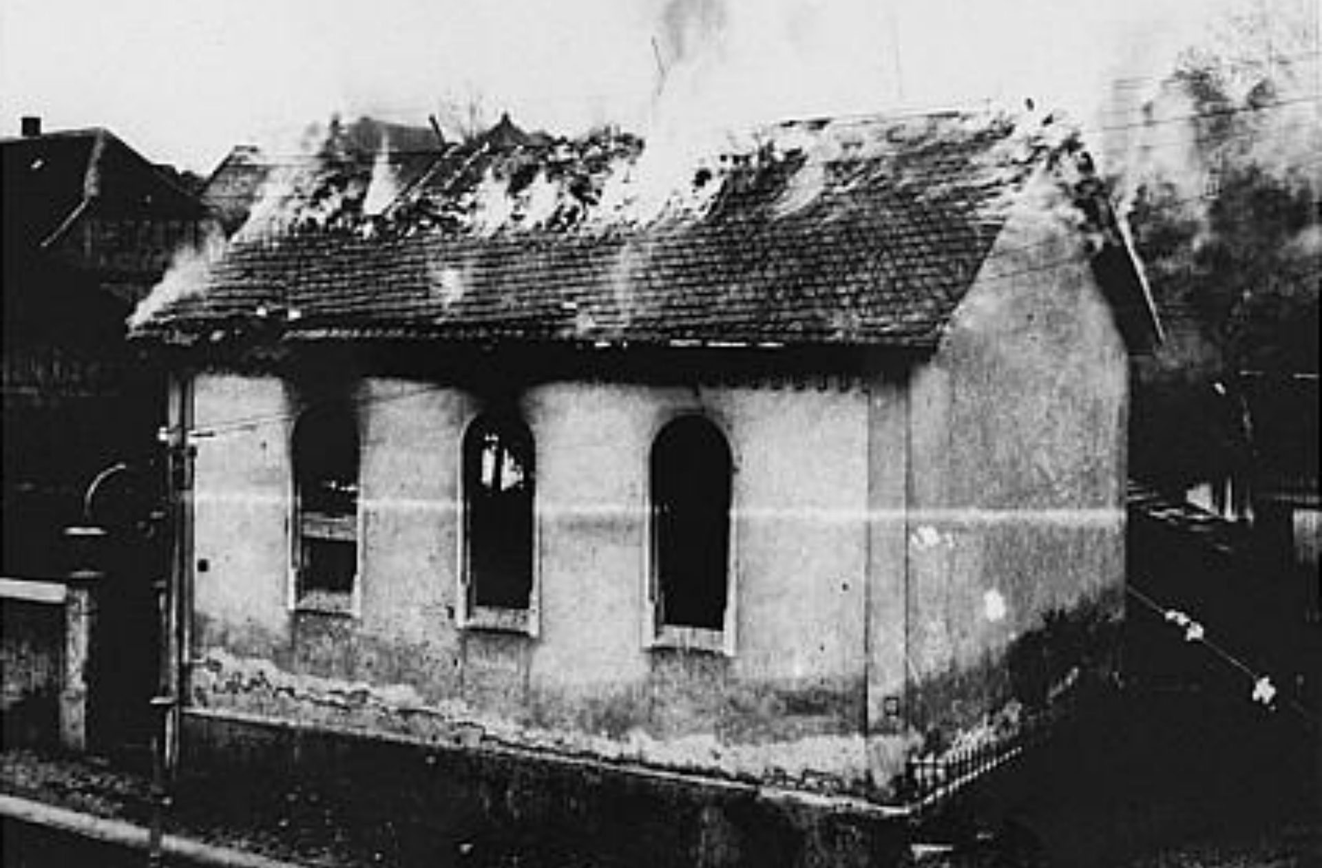
Синагога в Оберрамштадте (город в юго-западной части Германии), горящая во время Хрустальной ночи. Оберрамштадт, Германия, 9-10 ноября 1938 г.