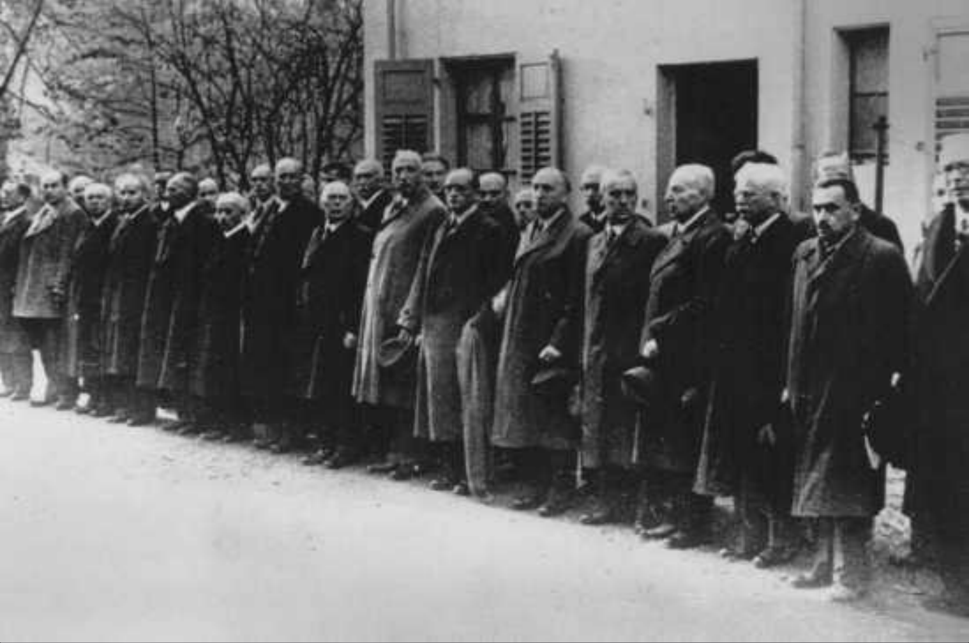
Евреи, арестованные после “Хрустальной ночи”, ожидают депортации в концентрационный лагерь Дахау. Баден-Баден, Германия, 10 ноября 1938 г.