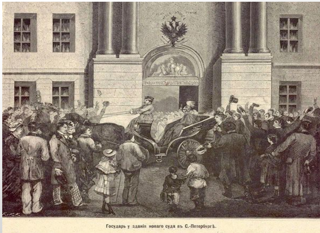
Государь у зданія новаго суда въ С.-Петербургѣ.

Судебная адвокатура не могла быть единственным средством защиты законных интересов российских подданных. Был легализован институт частной адвокатуры, по функциям напоминающий ходатаев прежних времен. Так называемые «частные поверенные» обязаны были получать особые свидетельства от судебных мест.