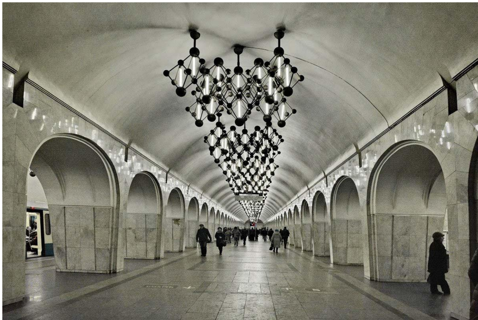
Станция метро «Маяковская»