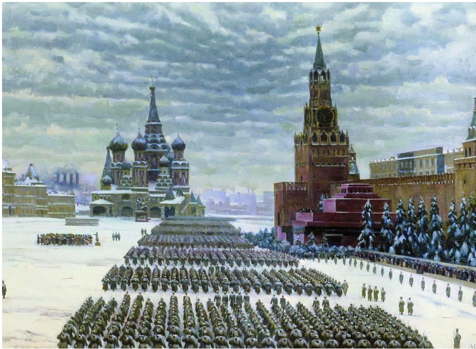
Военный парад 1941 года