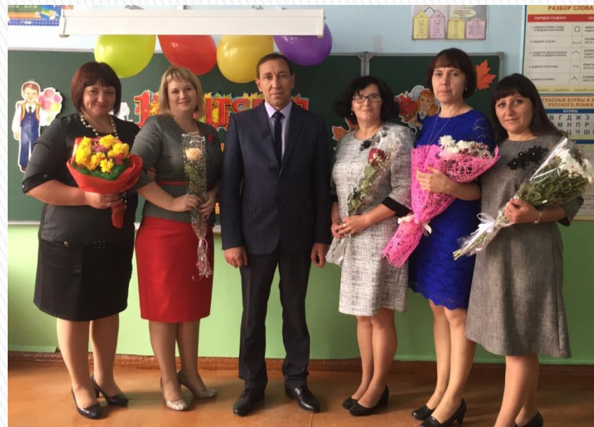
Учителя начальной школы