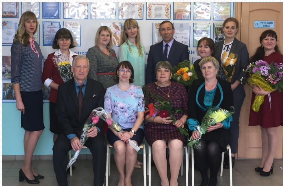
Учителя старших классов