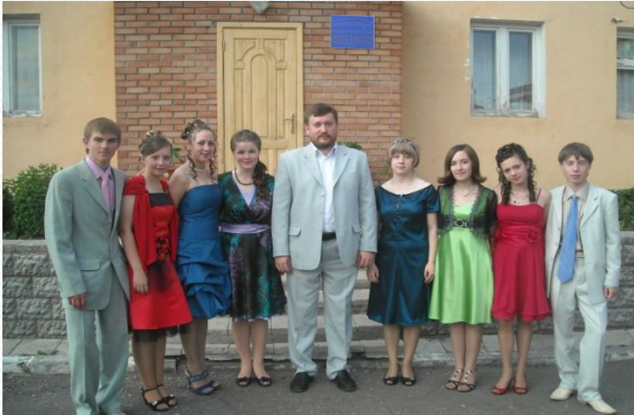
Первые выпускники школы