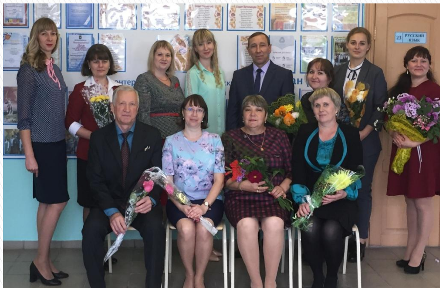
Учителя старших классов