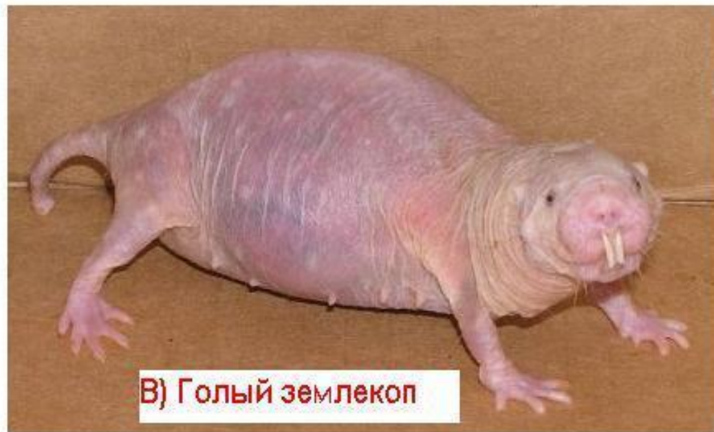
В) Голый землекоп