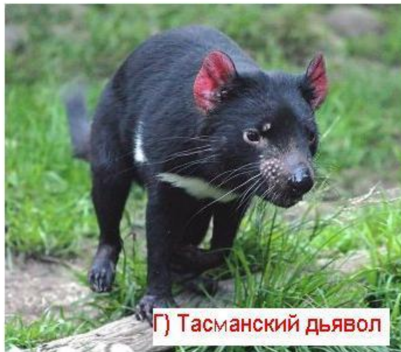
Г) Тасманский дьявол