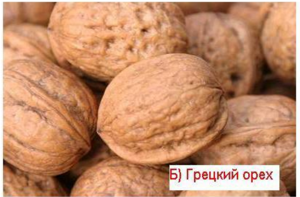
Б) Грецкий орех