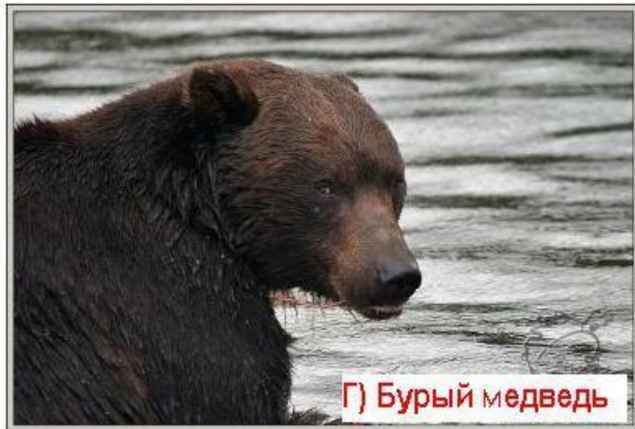
Г) Бурый медведь