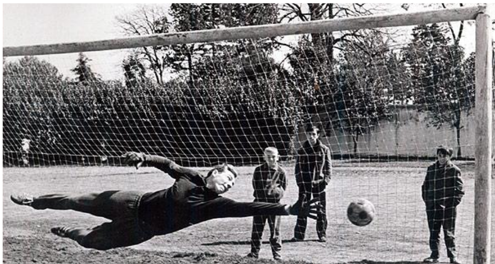
Абхазия. Тренировка юношеской сборной СССР, 1968г.