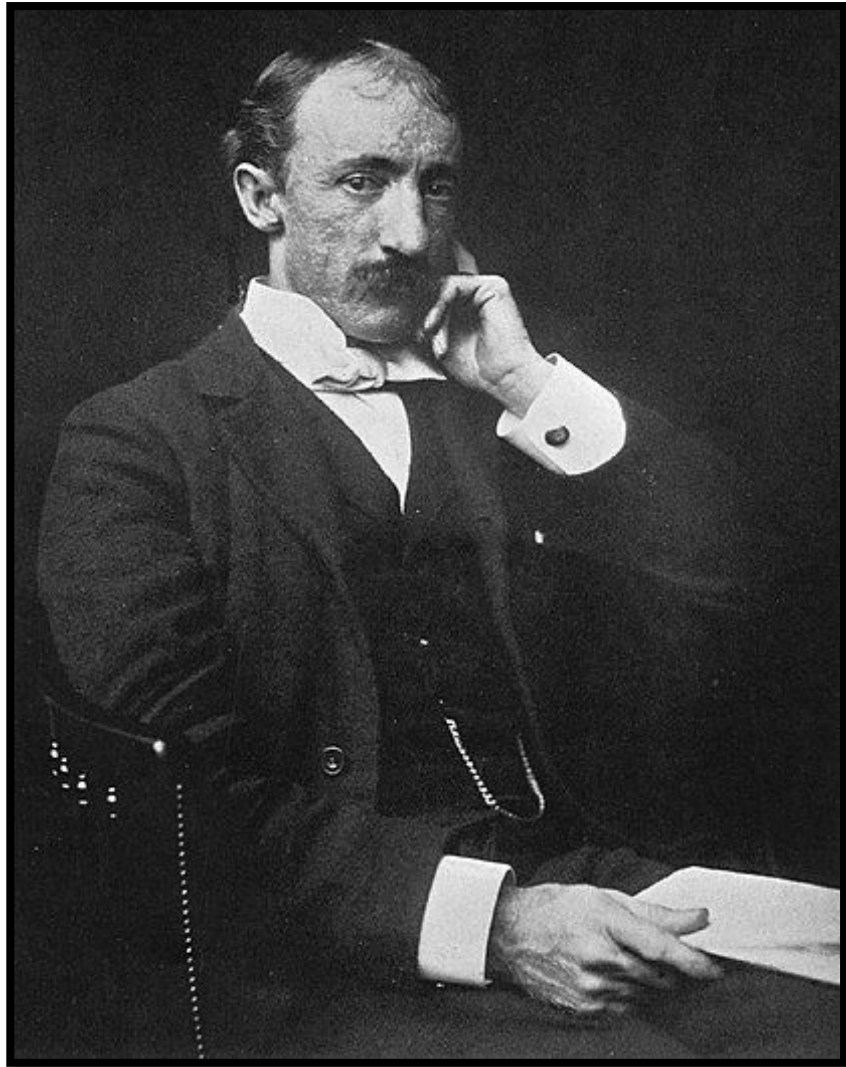
Ф.Г. Кушинг – американский археолог, этнограф и защитник прав

Был первым, кто использовал метод «включенного наблюдения»