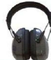
Наушники Лайтнинг П1