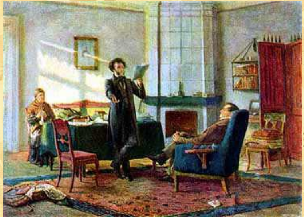
Пушкин в селе Михайловском (Пушкин у Пушкина). Н.Н. Ге. 1875 г.

За три года ссылки написаны "Кавказский пленник", "Бахчисарайский фонтан", а также "Узник", "Песнь о Вещем Олеге». Начат роман в стихах "Евгений Онегин".