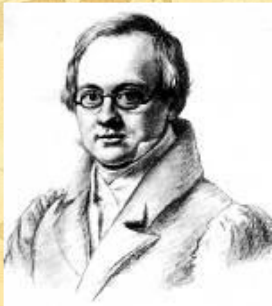
Антон Антонович Дельвиг