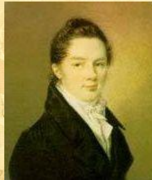
Иван Иванович Пуцин

Пушкин сохранил лицейскую дружбу и культ Лицея на всю жизнь.