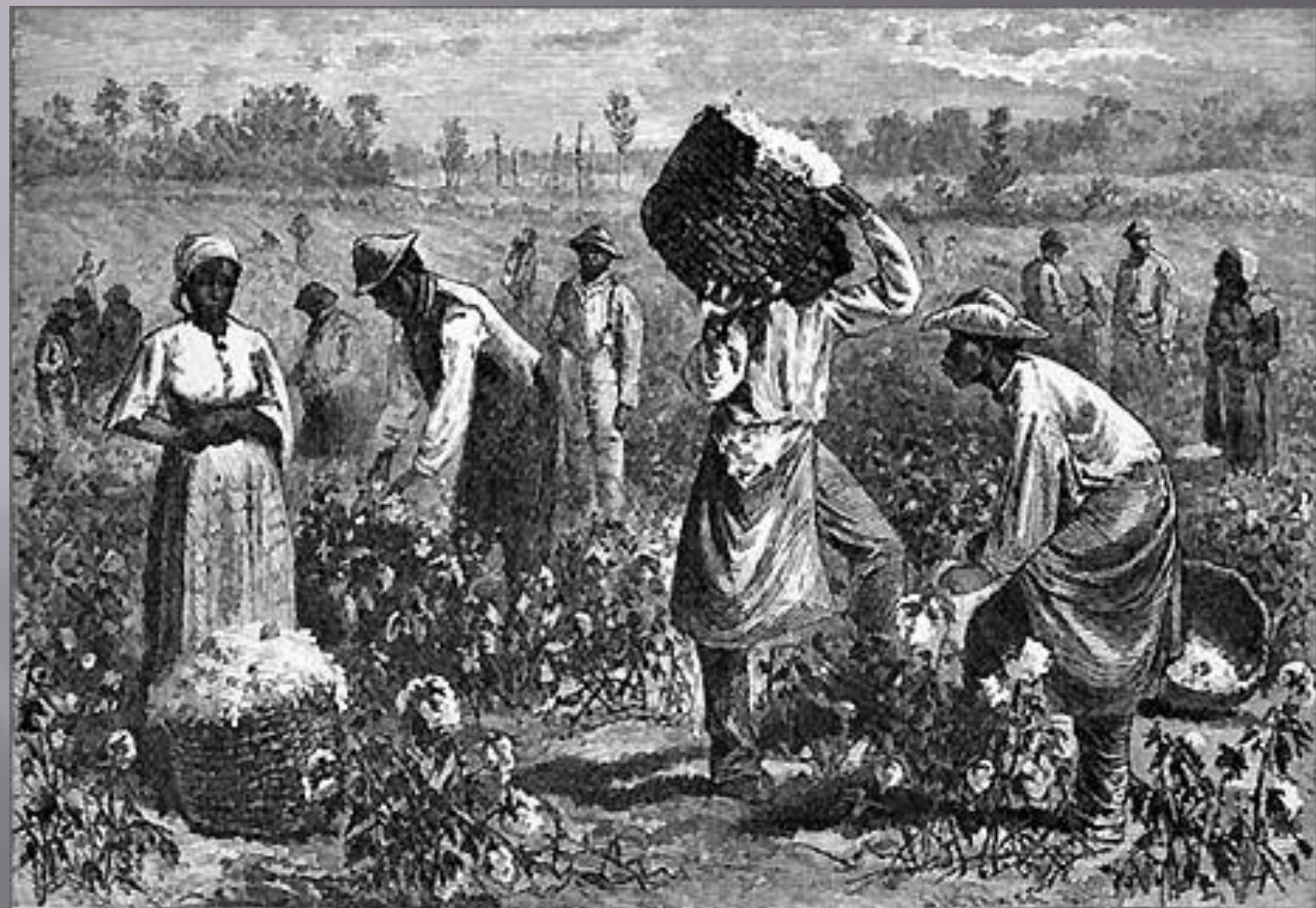
Scene on a Cotton Plantation.