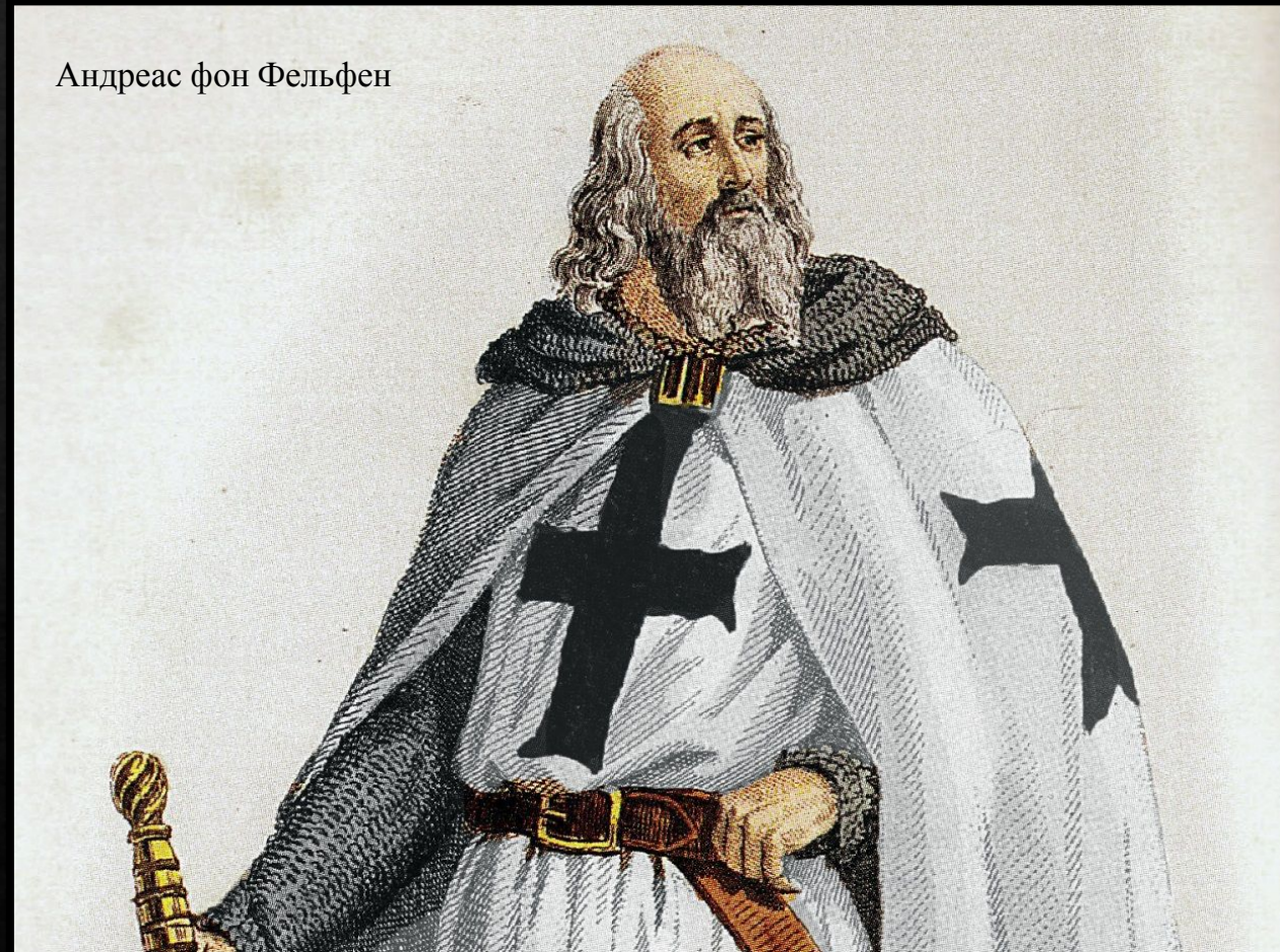
Андреас фон Фельфен

Датскими рыцарями командовали сыновья самого короля Вальдемара II.