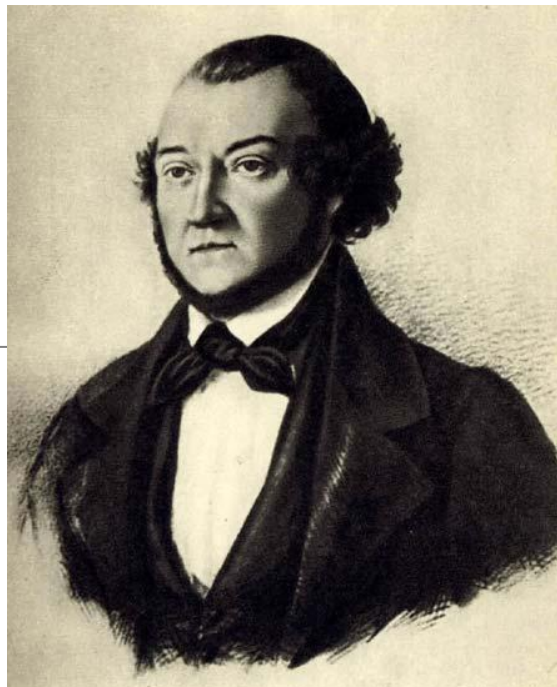
Александр Александрович Алябьев

композиторская и исполнительская школа. К периоду раннего романтизма в русской музыке относятся такие композиторы 19 века, как