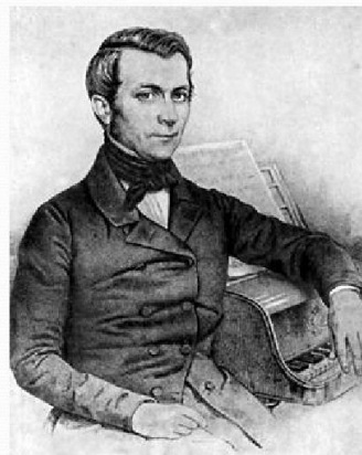
Александр Львович Гурилев (1803-1858)