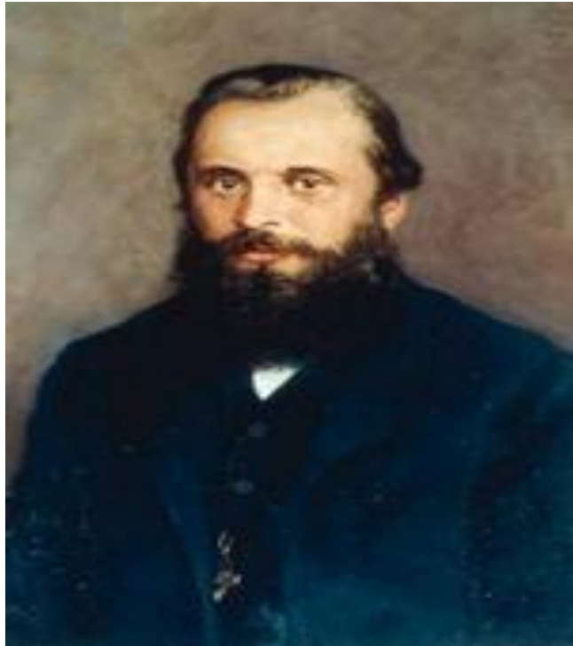
Милий Алексеевич Балакирев

В конце 1850-х-начале 1860-х годов в Санкт-Петербурге образовалось творческое содружество, которое возглавил Милий Алексеевич Балакирев (1837-1910), а идейным вдохновителем был Владимир