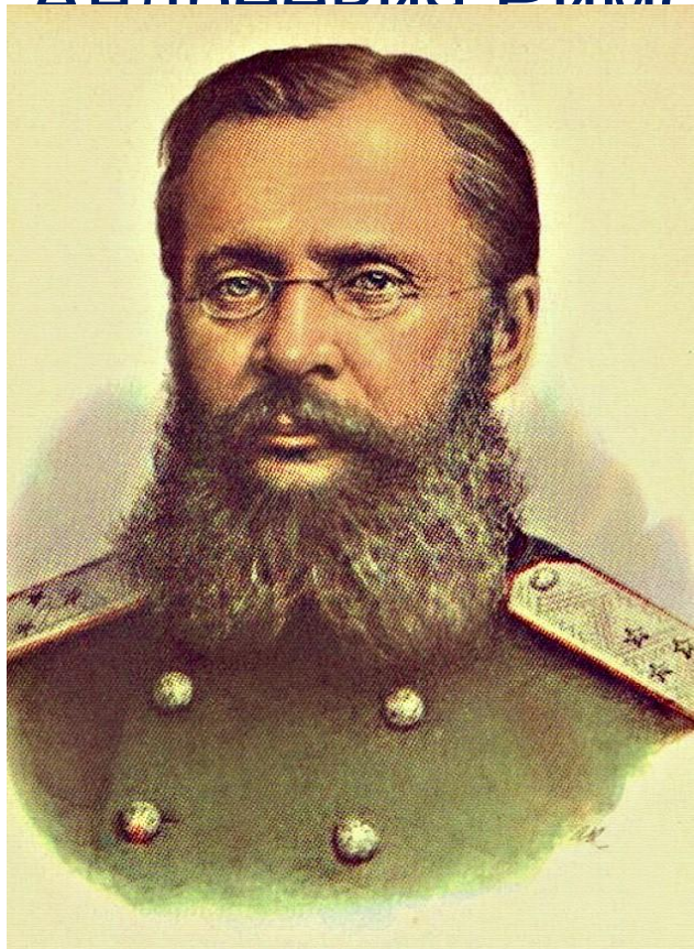
Николай Андреевич Римский-Корсаков