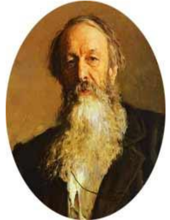
Владимир Васильевич Стасов

В конце 1850-х-начале 1860-х годов в Санкт-Петербурге образовалось творческое содружество, которое возглавил Милий Алексеевич Балакирев (1837-1910), а идейным вдохновителем был Владимир