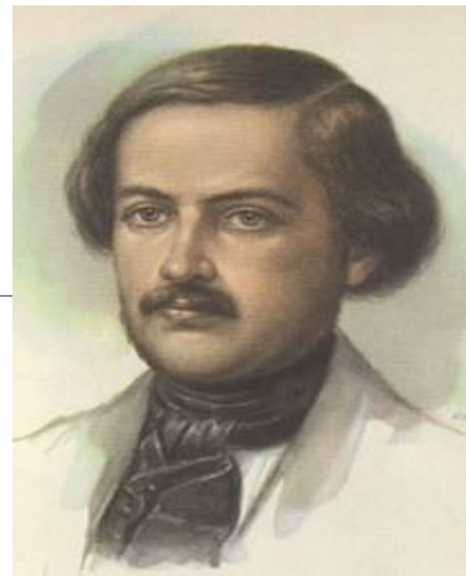
Александр Егорович Варламов