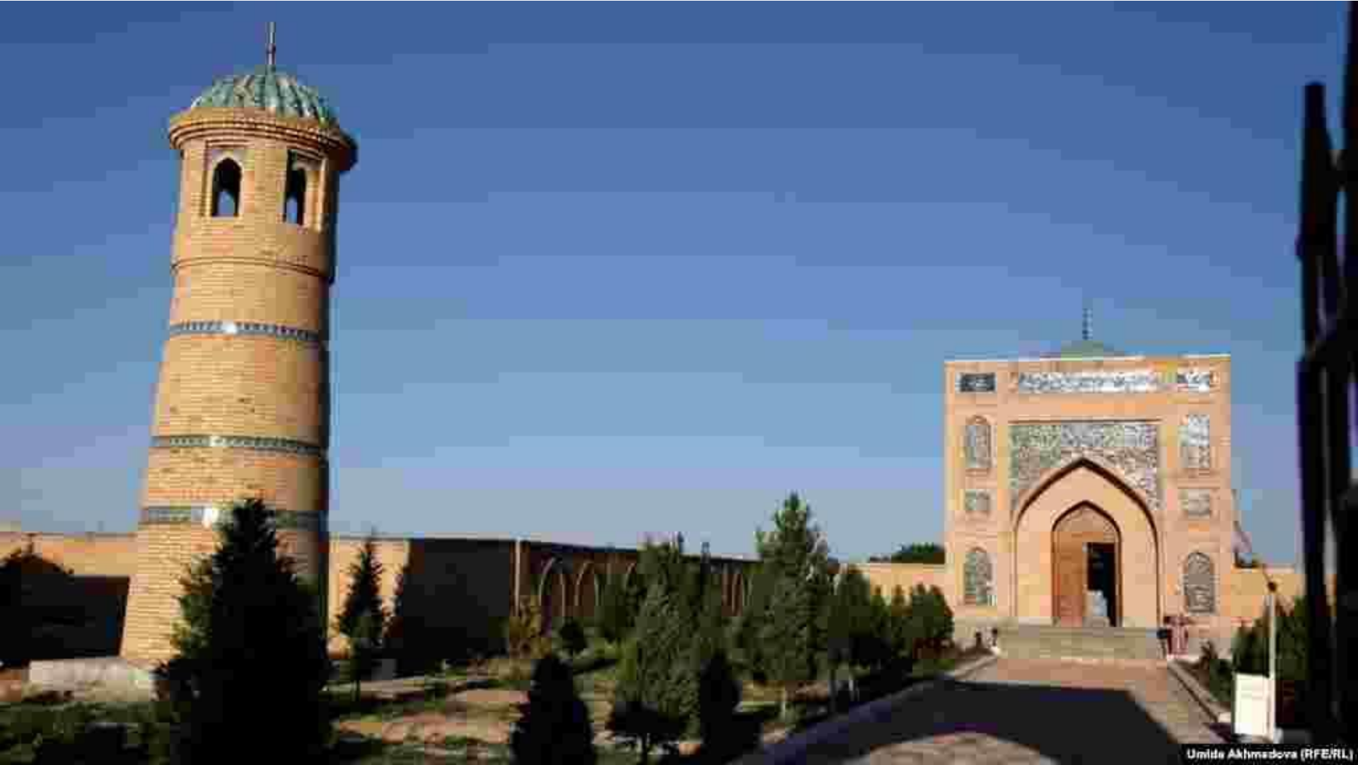
Umida Akhmedova (RFE/RL)