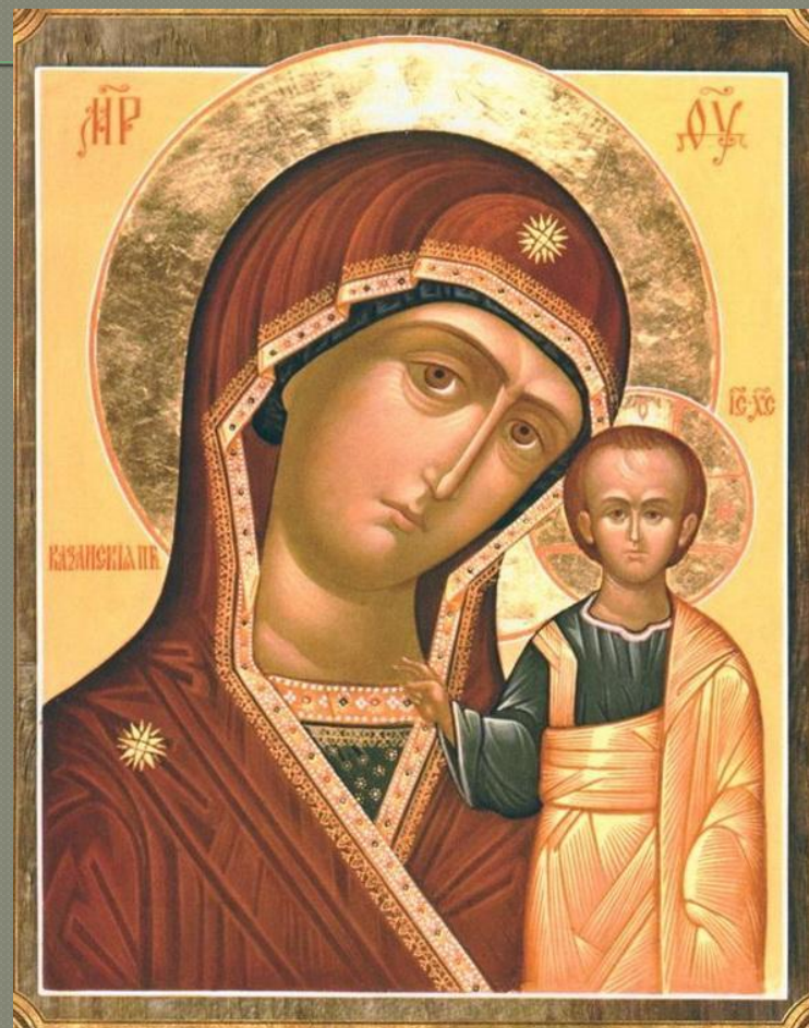
Казанская икона Божией Матери.