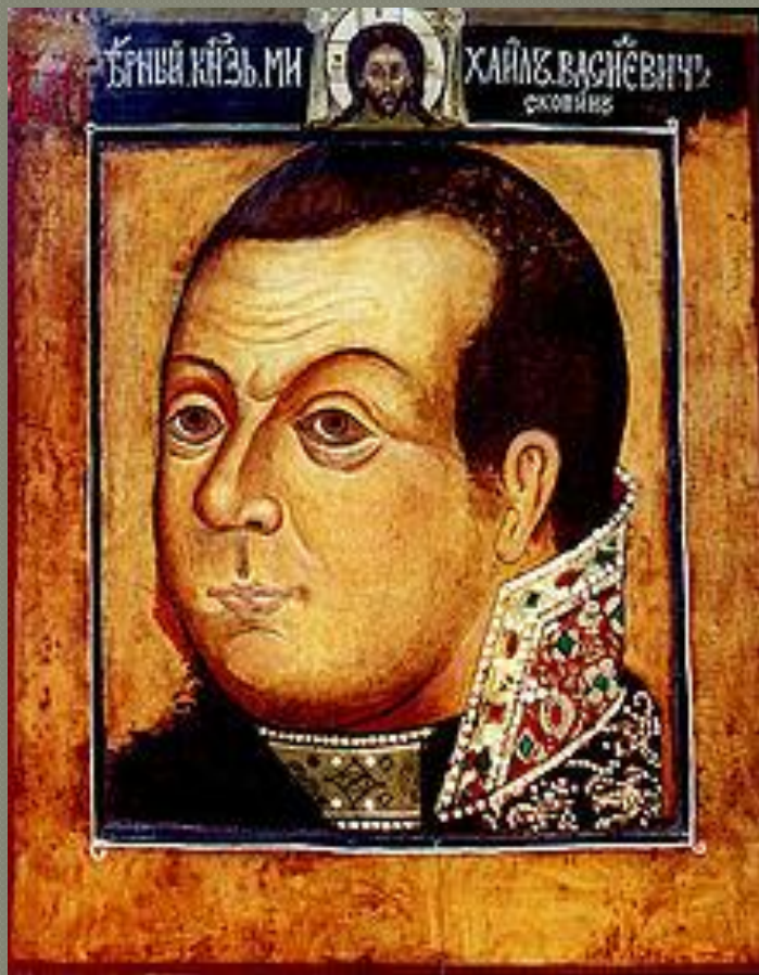
Надгробный портрет Скопина-Шуйского (1670-е, ГТГ)