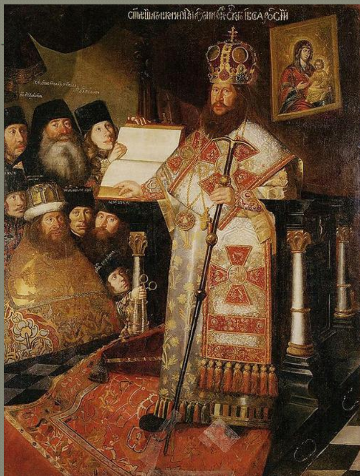
Иерарх Русской Церкви патриарх Никон.