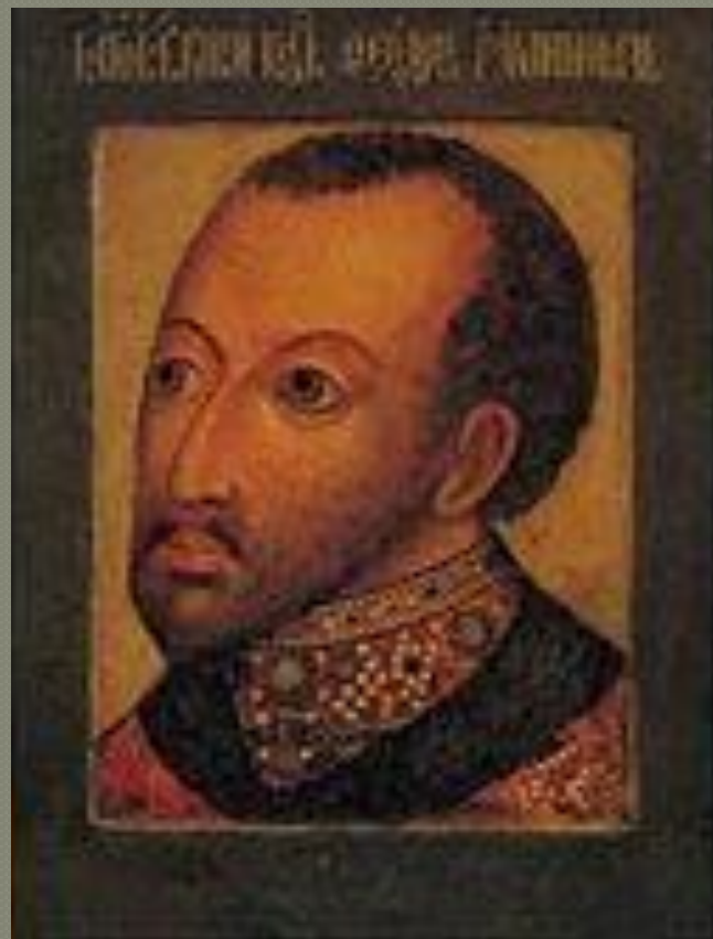
Федора Ивановича (1600)