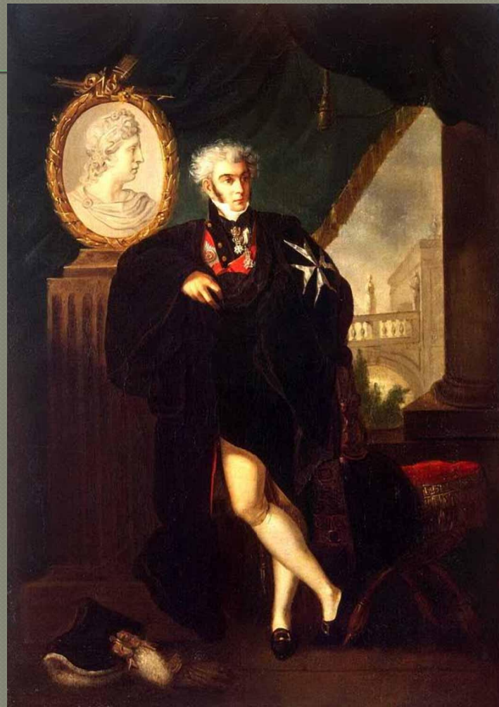
Портрет Дмитрия Львови ча Нарышкина.