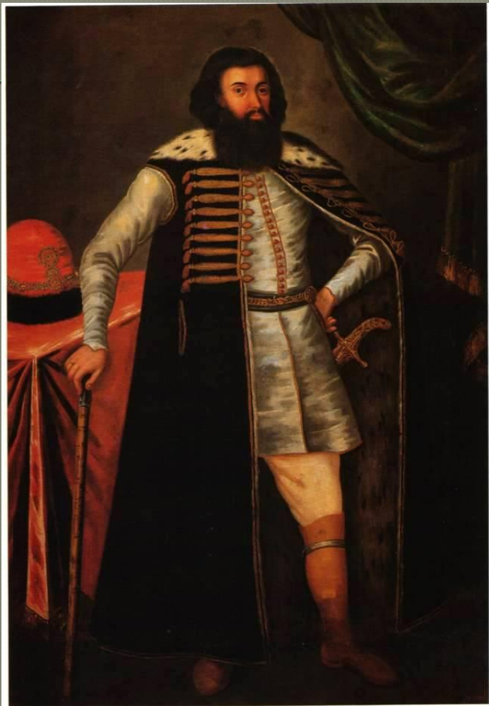
Портрет князя Ивана Борисовича Репнина.