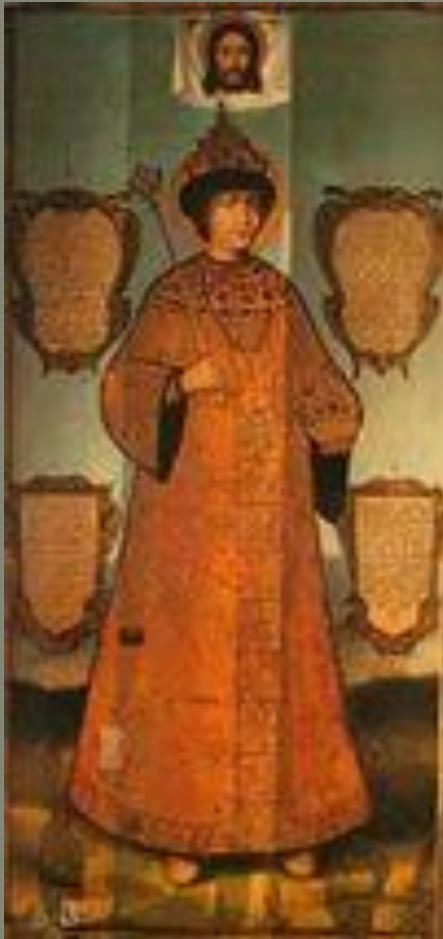
Портрет царя Федора Алексееви ча