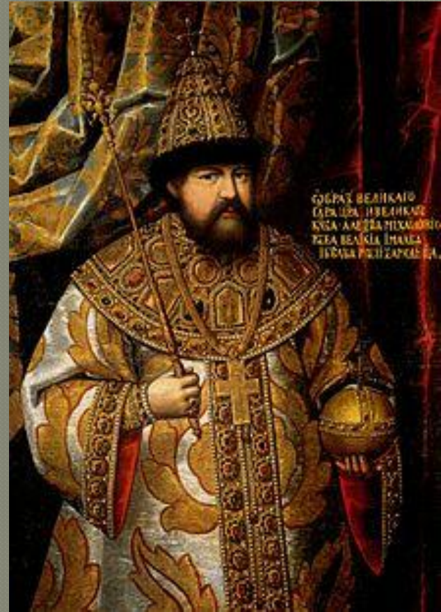
Алексей Михайлович в «большом наряде» (1682, ГИМ)