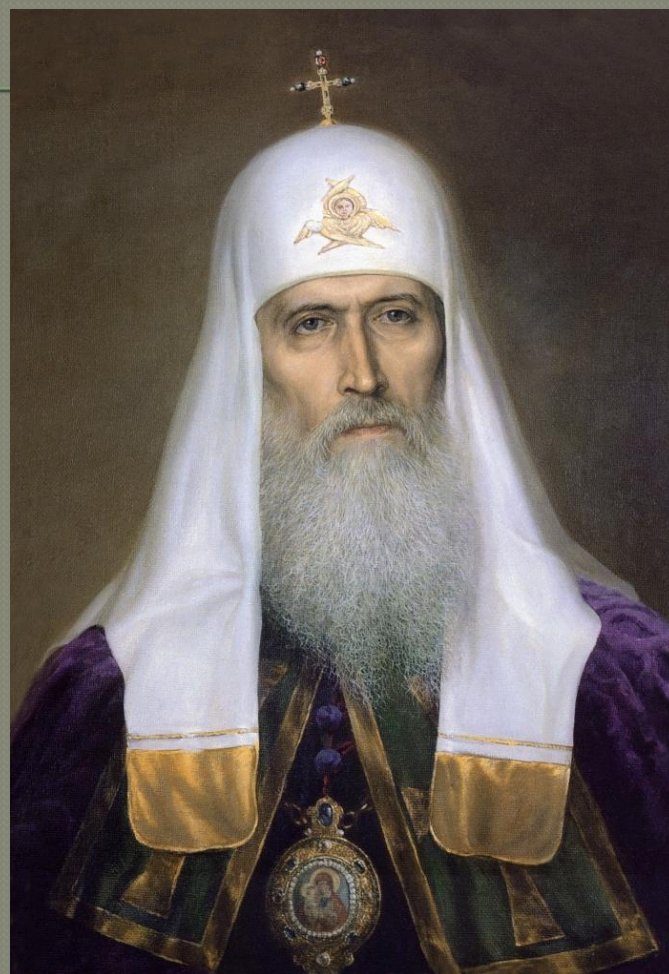
Иоаким Патриарх Московский и Всея Руси (1674-1690)