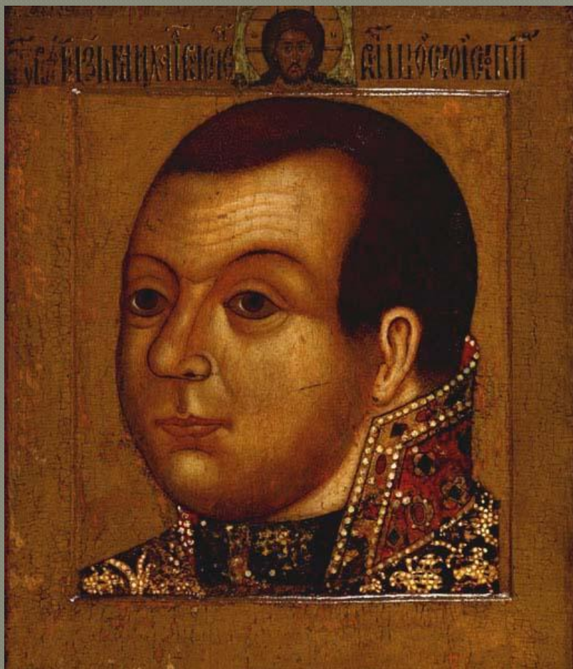
Симон Ушаков. (парсуна)