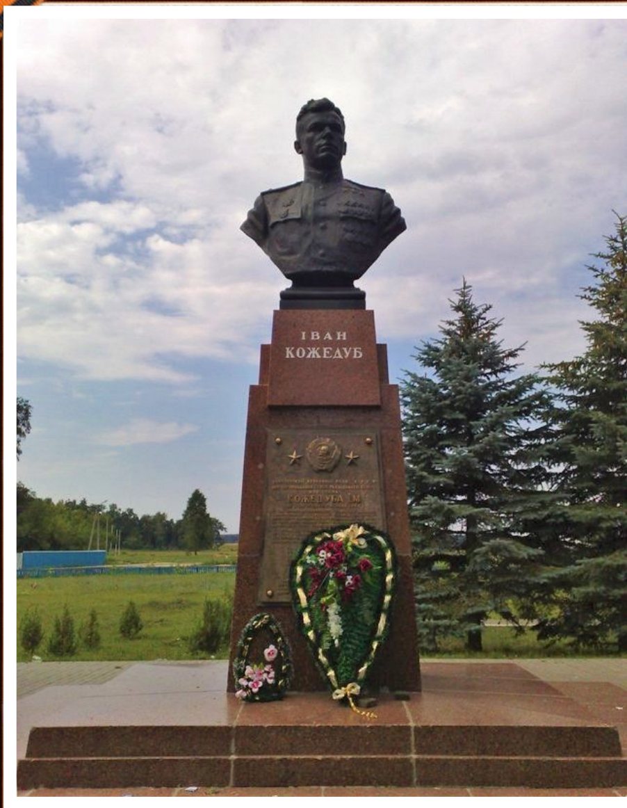
Памятник в селе Ображиевка

Бронзовый бюст героя установлен на родине в селе Ображиевка. Здесь же открыт его музей.