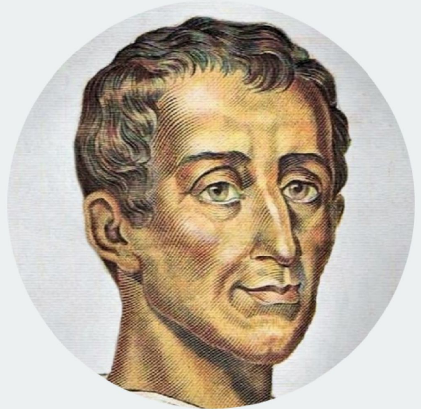
Шарль де Монтескье