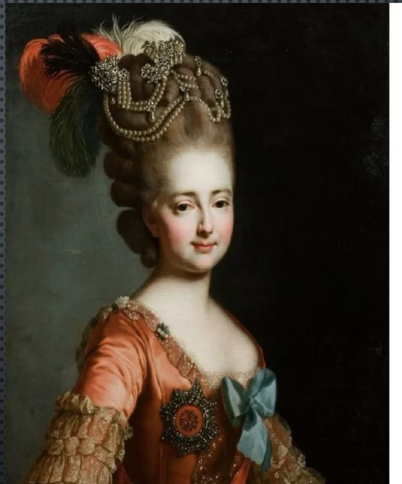
АЛЕКСАНДР – СТАРШИЙ СЫН ПАВЛА I И МАРИИ ФЕДОРОВНЫ.