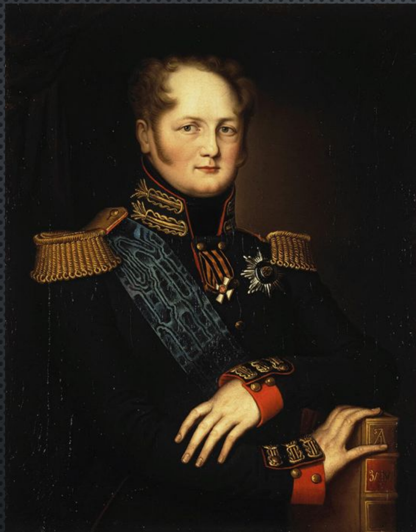
АЛЕКСАНДР ПАВЛОВИЧ РОМАНОВ, БУДУЩИЙ ДЕСЯТЫЙ ИМПЕРАТОР И САМОДЕРЖЕЦ ВСЕРОССИЙСКИЙ, РОДИЛСЯ 12 ДЕКАБРЯ (23 ДЕКАБРЯ ПО НОВОМУ СТИЛЮ) 1777 ГОДА В САНКТ-ПЕТЕРБУРГЕ