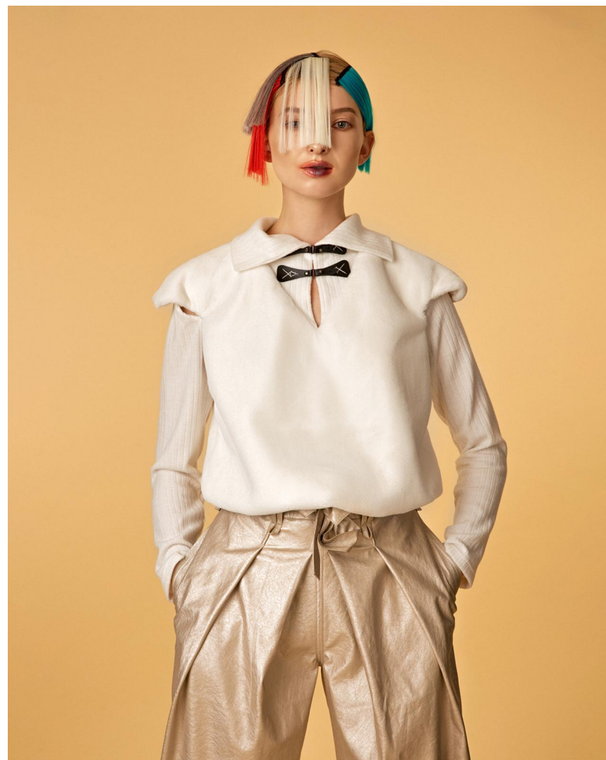
Кофта белая, меховая Состав: эко-мех на подкладе Артикул: 8.100.03