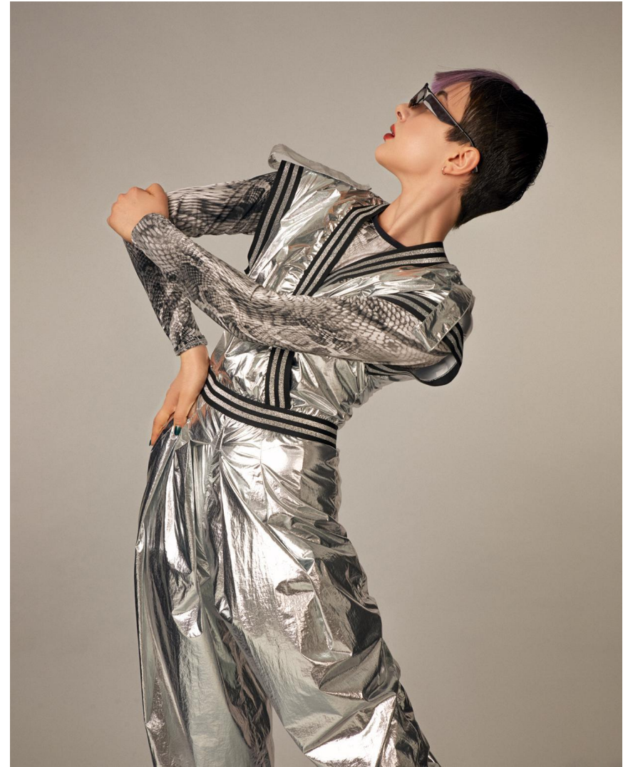
Комбинезон серебряный без рукавов Состав: Плащевка металлизированная, полиэстер 100% Артикул: 8.600.04