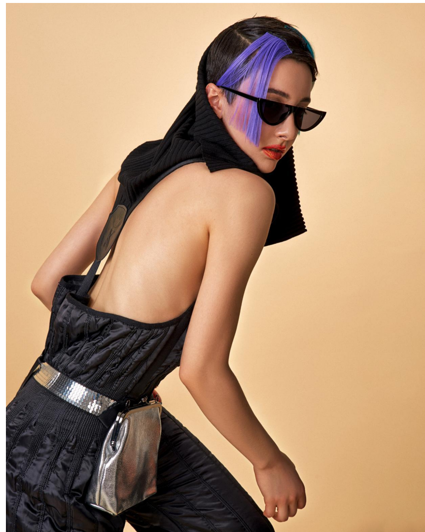
Леггинсы со шнуровкой Состав: Полиамид 80%, вискоза 10%, эластан 10% Артикул: 8.220.03