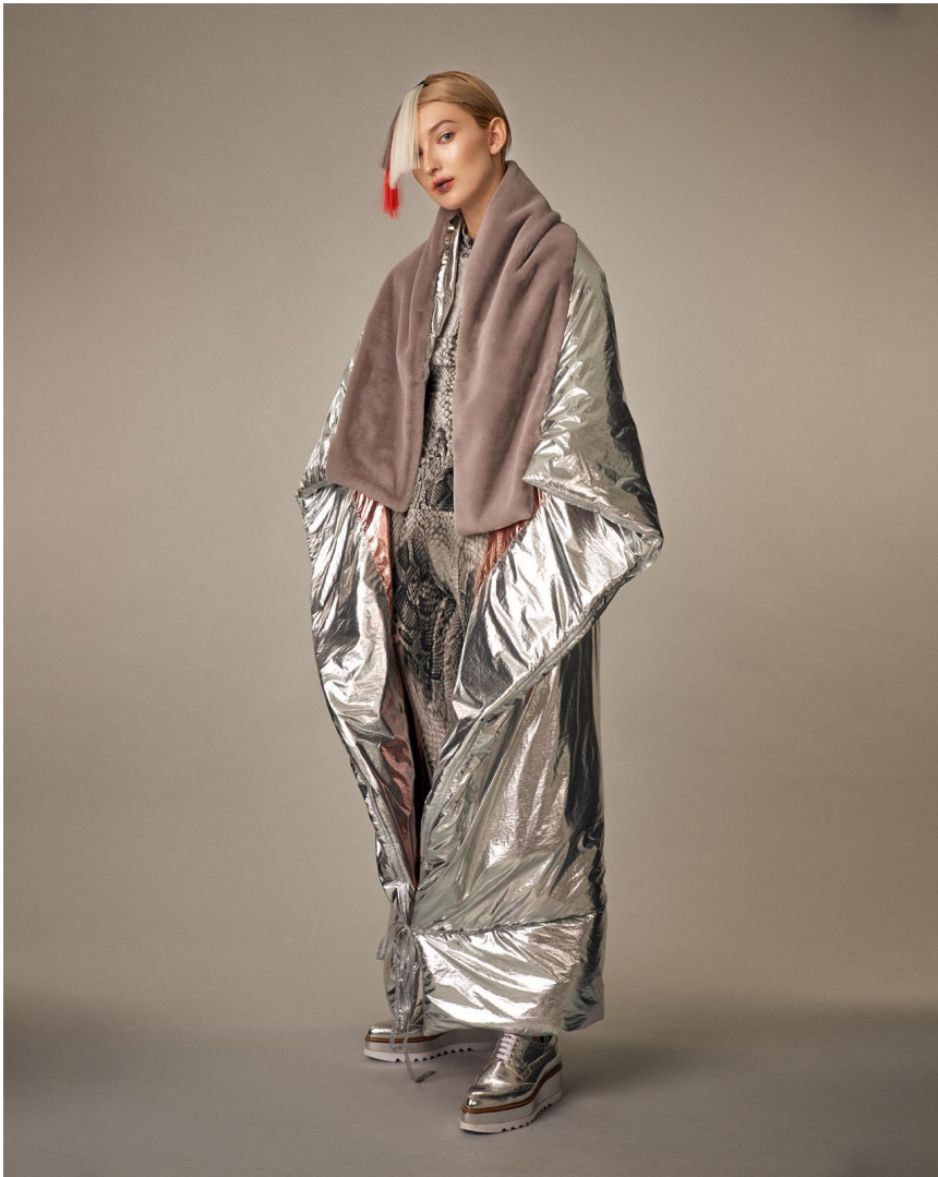
Пальто, серебро Состав: деним 100%, полиэстер Артикул: 8.450.01