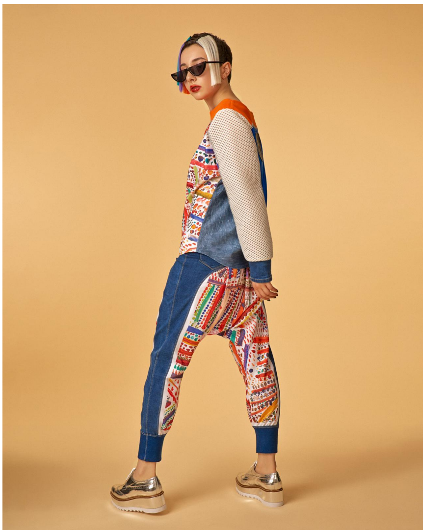
Туника «Перспективы» с сеткой Состав: футер 70%, синтетика 30% Артикул: 8.170.01