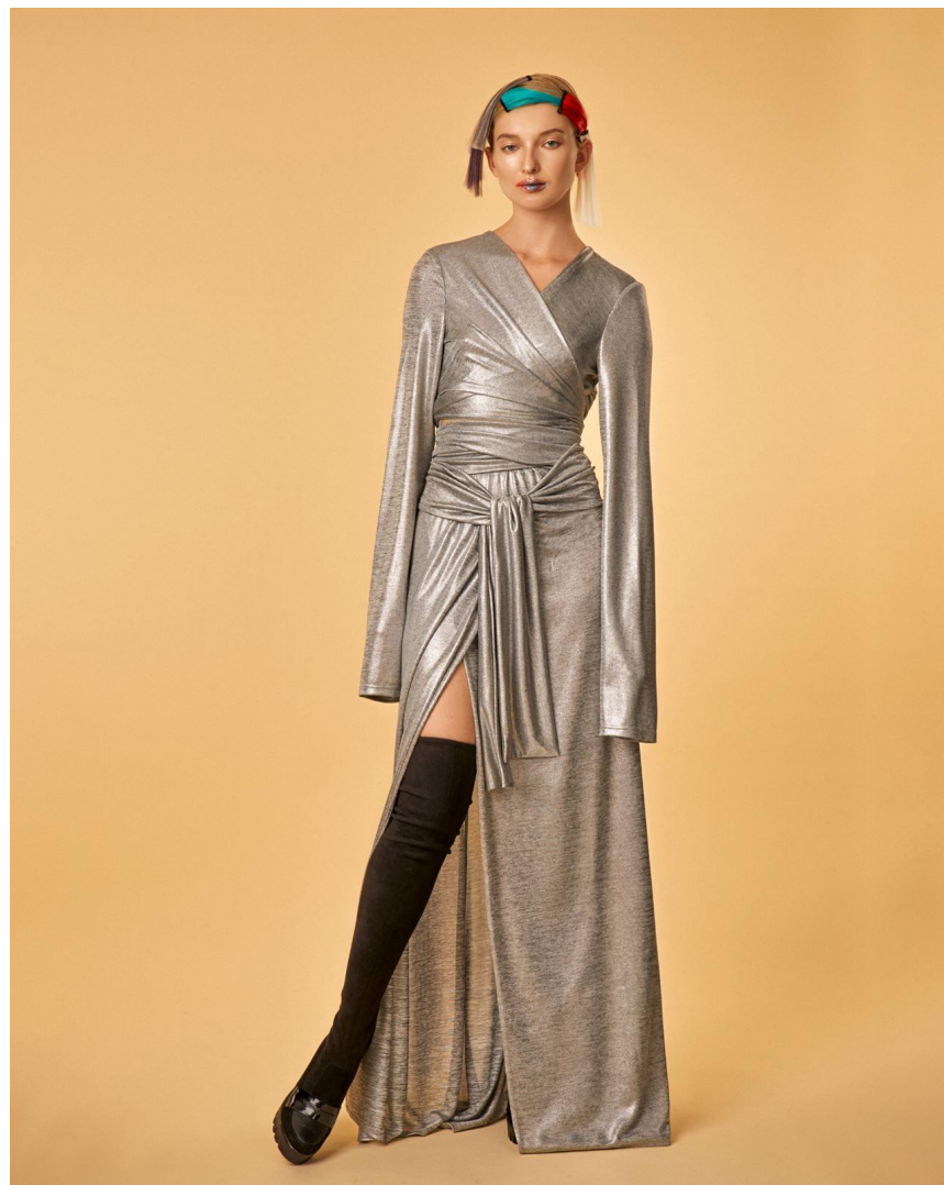
Комбинезон серый с рукавами Состав: Трикотажное полотно, 50% вискоза, 50% полиэстер Артикул: 8.600.02