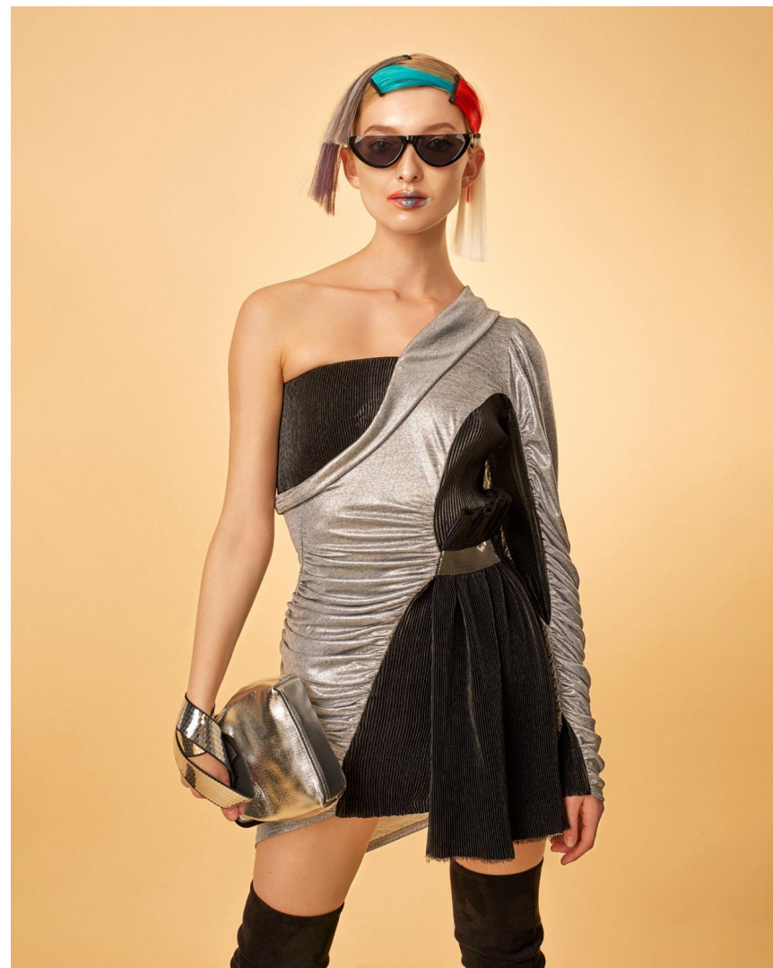
Платье с 1 рукавом, серебро Состав: гофре + 100% металлизированная вискоза Артикул: 8.500.01