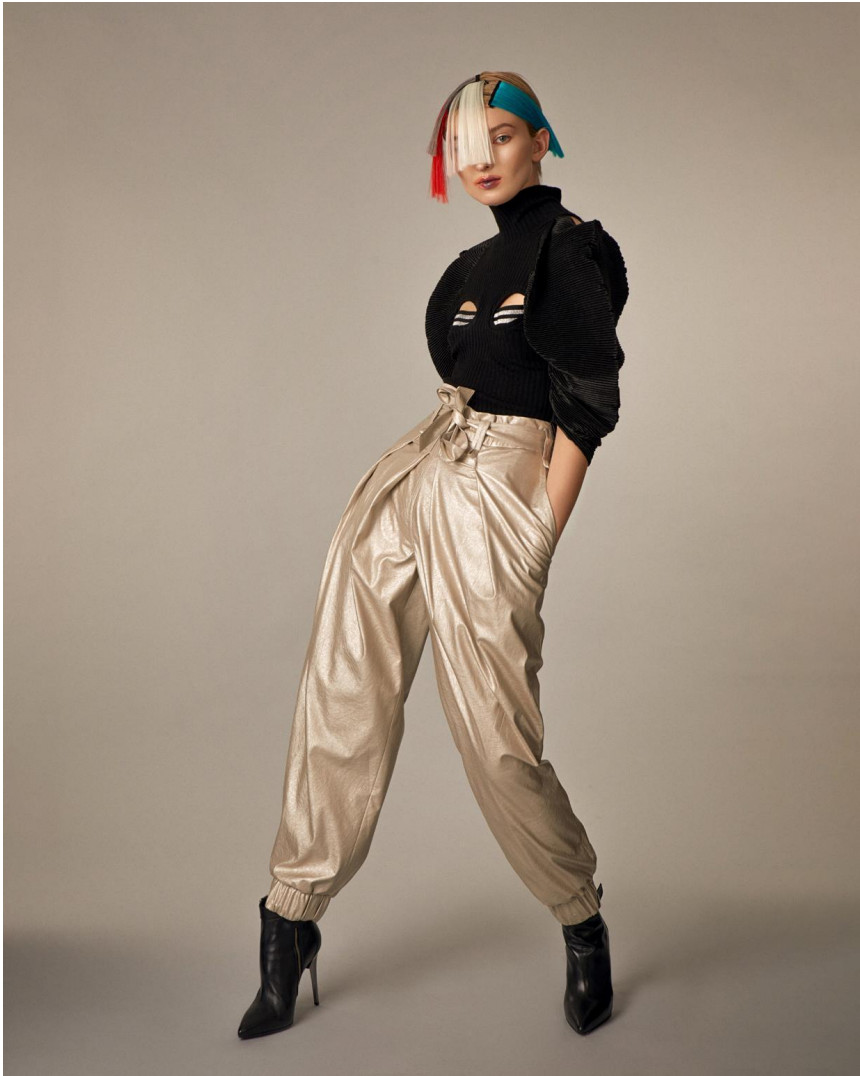
Кофта гофре Состав: вискоза 60%, полиэстер 40% Артикул: 8.100.05