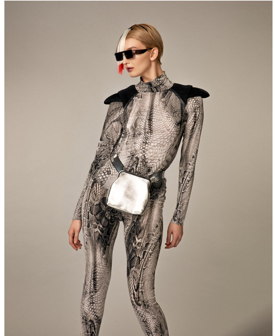
Кофта серая с погонами Состав: вискоза 100% Артикул: 8.100.02