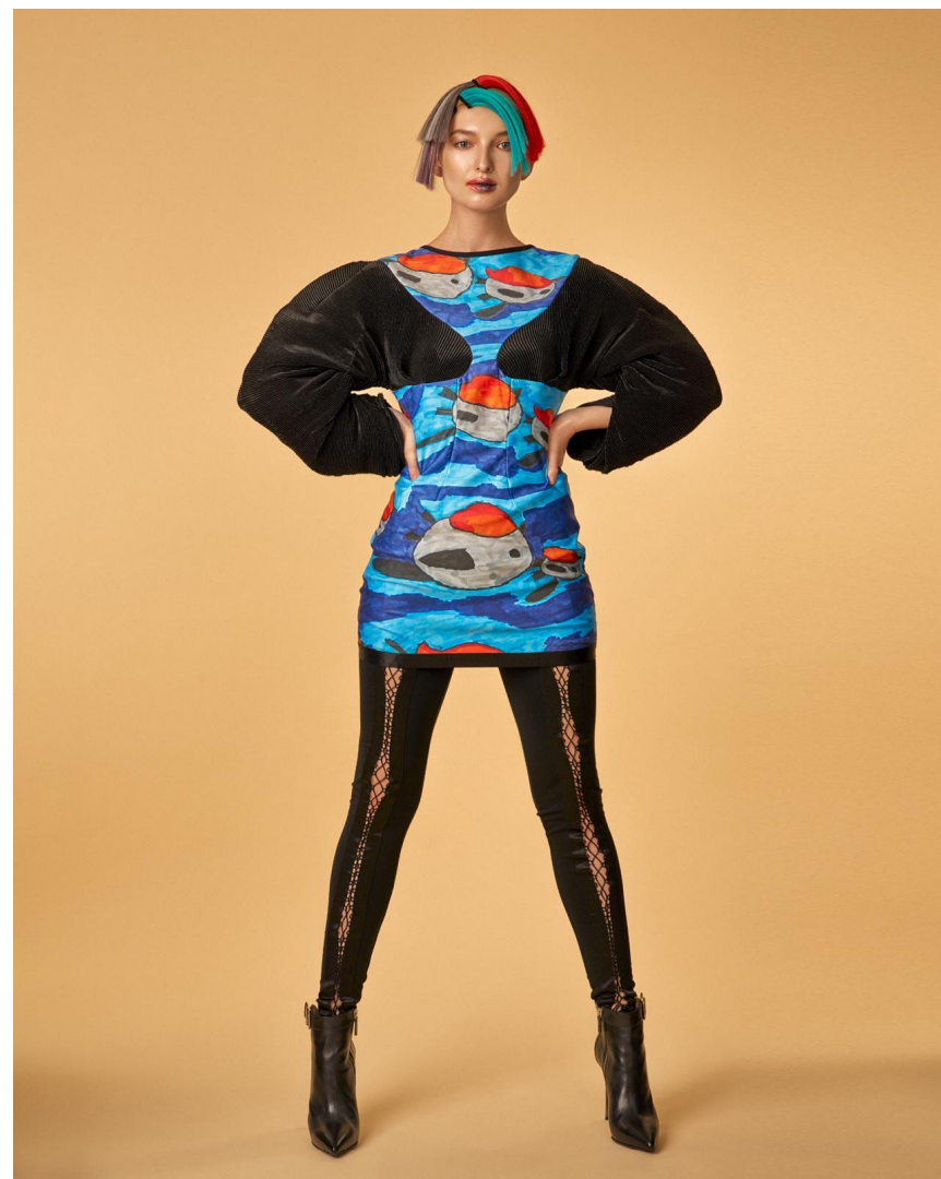
Платье «Перспективы», гофре Состав: футер, гофре Артикул: 8.500.03