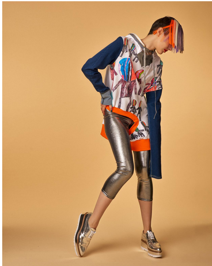
Название: Туника «Перспективы» с капюшоном Состав: хлопок 70%, полиэстер 30% Артикул: 8.170.02