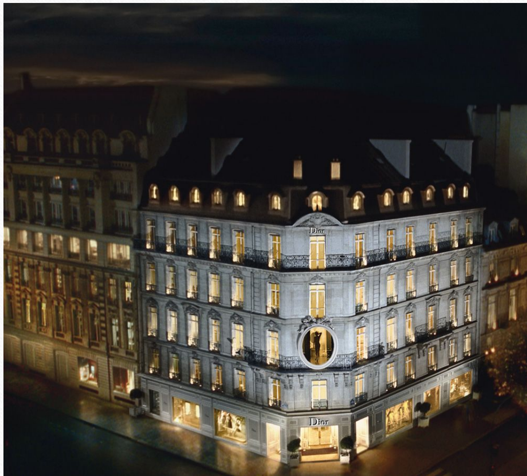
Модный дом Dior, Париж

Далее заправляли главным домом Марк Боан, Джанфранко Ферре, Джон Гальяно, Эди Слиман, Крис ван Аш, Раф Симонс. В настоящее время Мария Грация Кьюри и Ким Джонс.