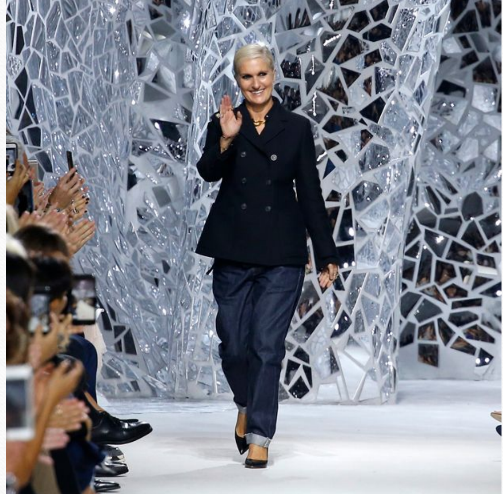
Мария Грация Кьюри