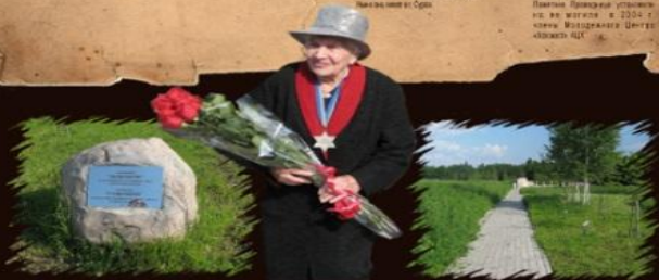
Аллея Праведников Смоленщины в Любавичах.

Иван Алексеевич Бунин и Вера Николаевна Муромцева-Бунина