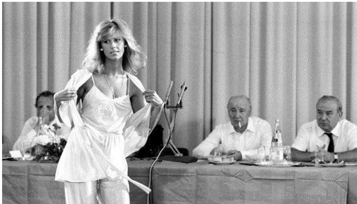
Янош Кадар на показе мод. 1984 г