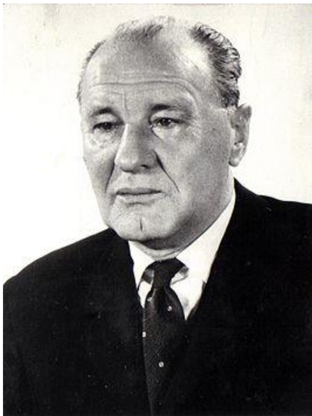
Янош Кадар (венг. Kádár János), до 1945 фамилия Черманек, (венг. Csermanek) (26.05.1912 - 6.06.1989)