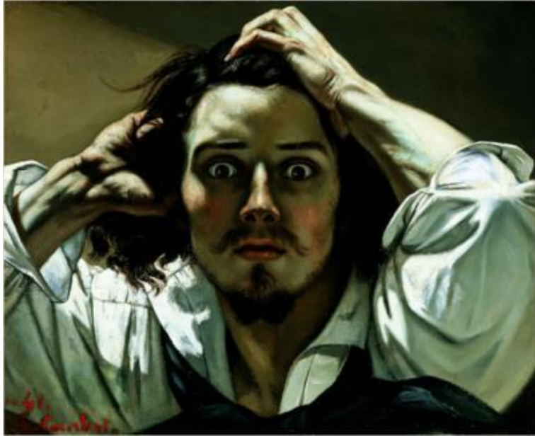
Отчаяние. Автопортрет – Гюстав Курбе Отчаяние.

РЕАЛИЗМ утверждается и становится господствующим направлением в европейской культуре в 30–40 гг. XIX в. Реализм призван объективно отражать действительность средствами, присущими тому или иному виду художественного творчества. Писатели и художники обличали пороки – стяжательство, социальное неравенство, эгоизм, лицемерие. Реализм интересуется жизнью сердца, души и разума в нормальном, естественном состоянии; ему свойственны идеи гуманизма и общественной справедливости.