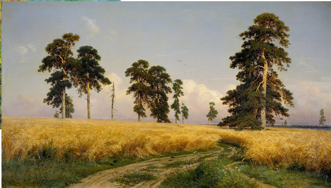
Клод Моне - Рыбацкий домик в Варенжвиле 1882