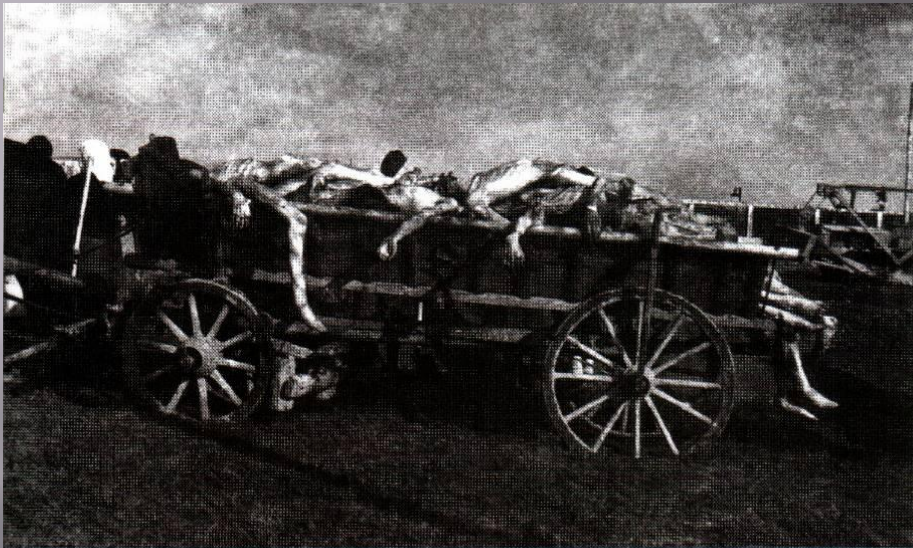
Тела жертв, уничтоженных в лагере Аушвиц-Биркенау.