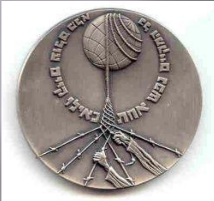
Медаль Праведника мира

Праведники народов мира - это, те, кто спасал евреев во время Холокоста, рискуя при этом собственной жизнью.