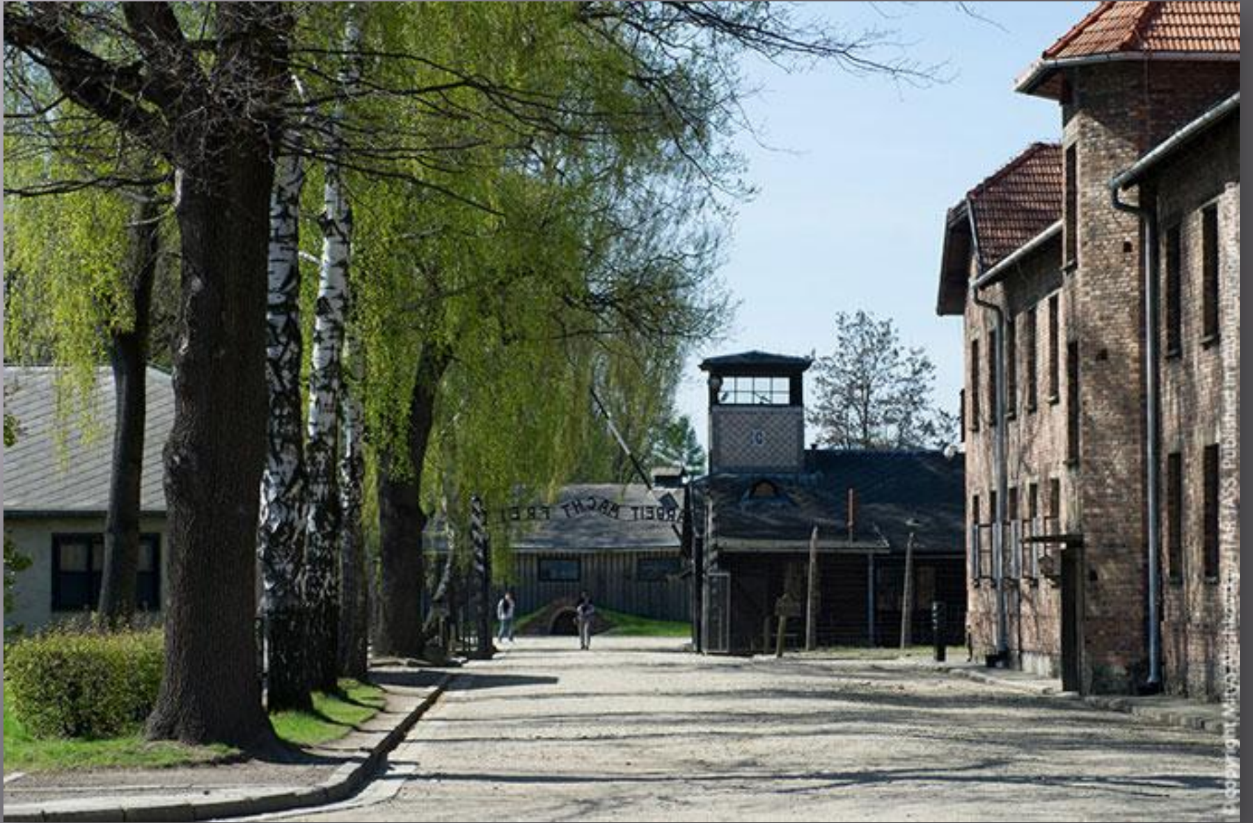
© 2012 All rights reserved. Published in the U.S. by ABC-CLIO, Inc.