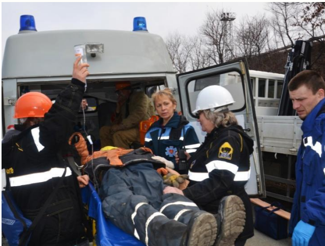
Передача пострадавших медикам скорой помощи для госпитализации