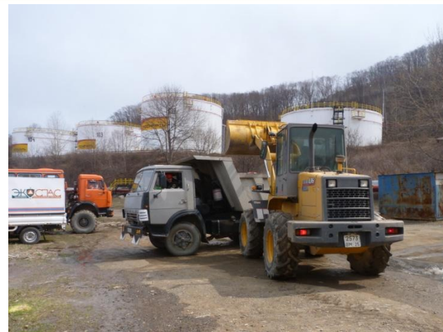
Работы по вывозу замазученного грунта и завозу чистого грунта