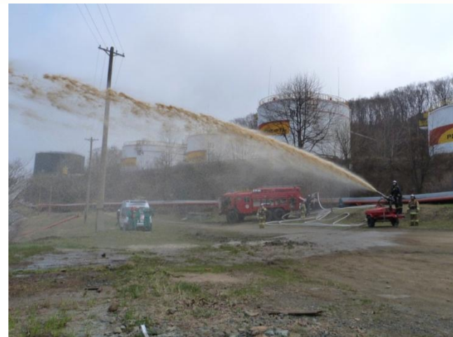
Покрывание зеркала разлива нефтепродукта воздушно-механической пеной