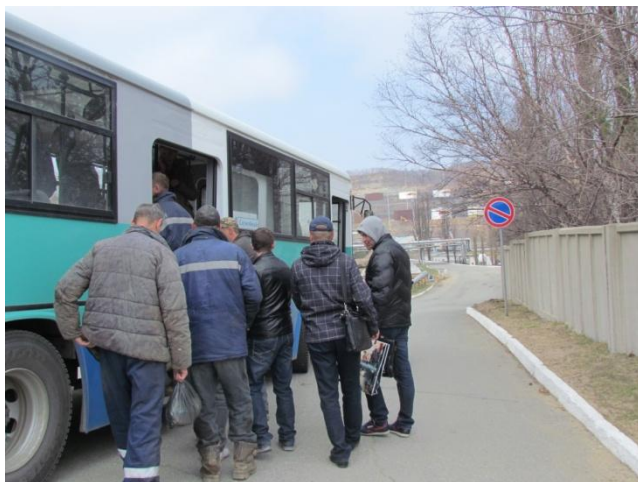
Эвакуация работников со здания управления нефтепорта