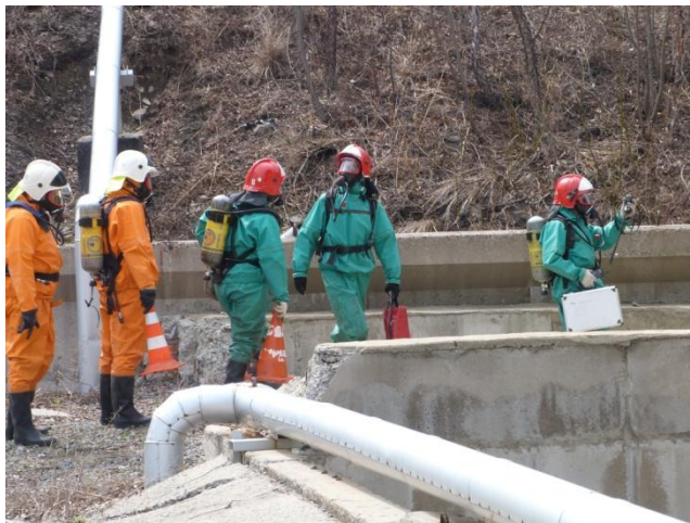
Определение зоны загазованности звеном газоразведки в составе ПАСФ и НАСФ