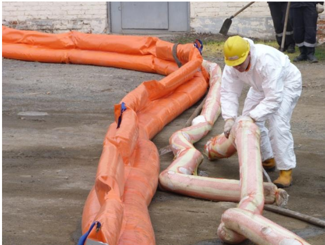
Использование сорбирующих бонов