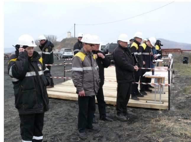
Штаб руководства учения