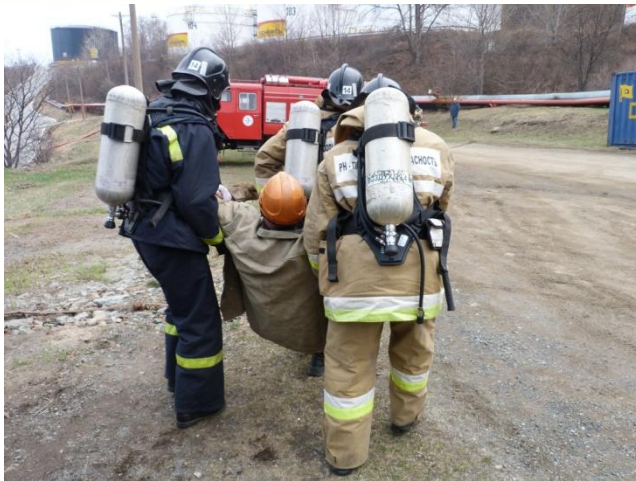
Эвакуация первого пострадавшего