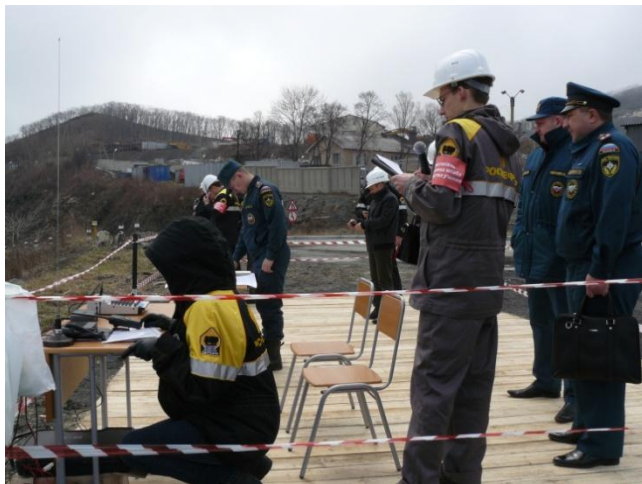
Участок комментирования действий участников учений