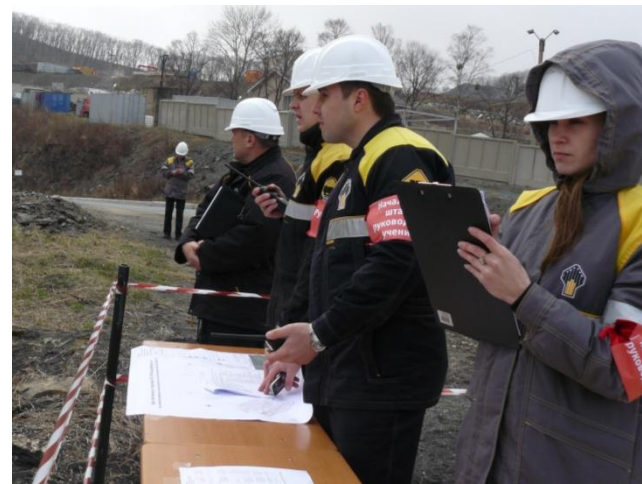
Штаб руководства учения