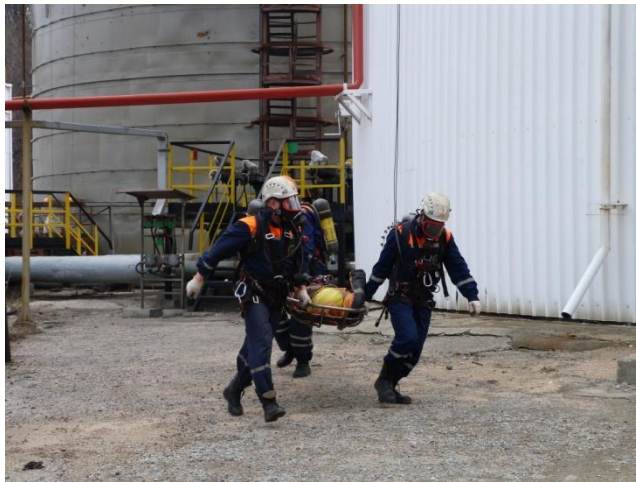
Эвакуация второго пострадавшего в санитарный пост