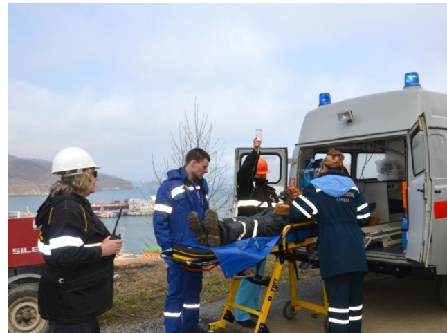
Передача пострадавших медикам скорой помощи