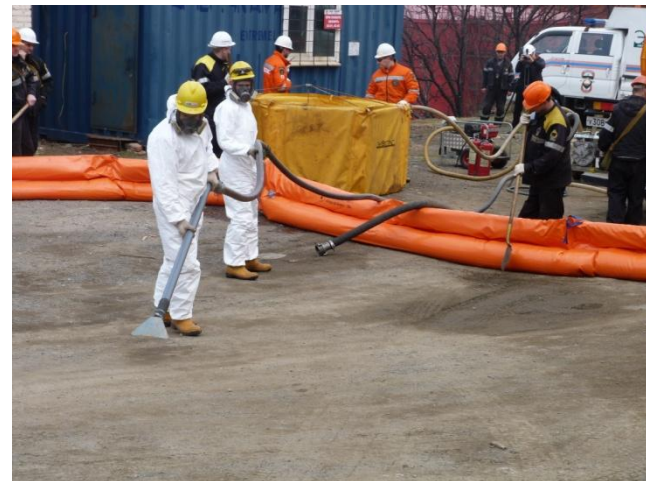
Сбор аварийного разлива нефтепродукта силами НАСФ и ПАСФ Приморский центр ЭКОСПАС АО «ЦАСЭО»