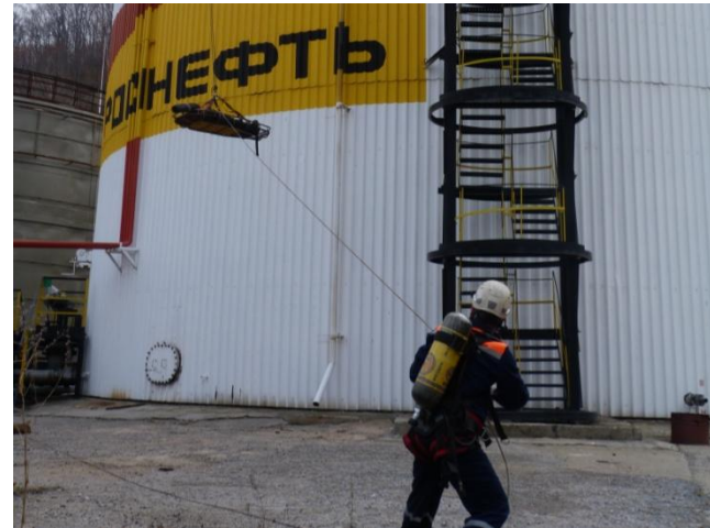
Эвакуация второго пострадавшего с крыши РВС № 71