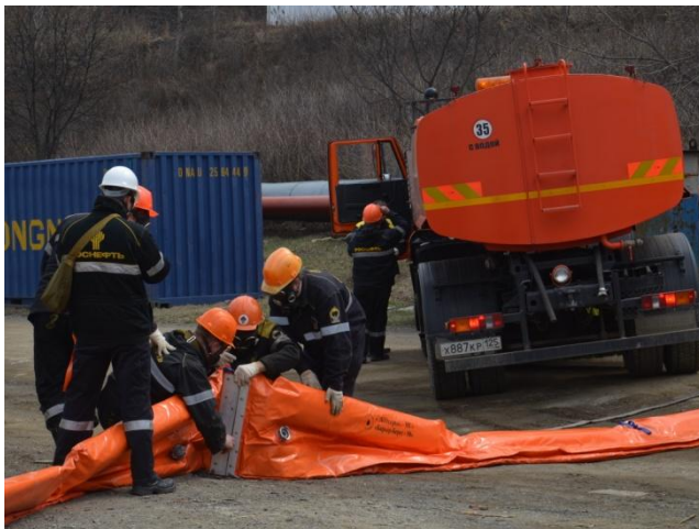
Установка бонового заграждения