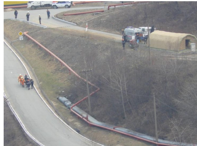
Эвакуация пострадавшего на санитарный пост