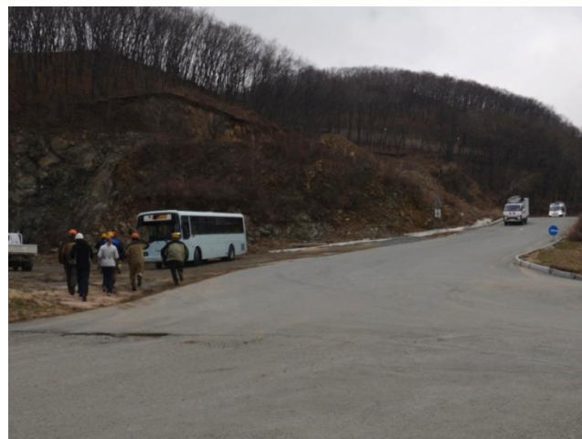
Эвакуация работников подрядных организаций