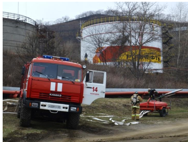
Развёртывание расчёта ПЧ-14