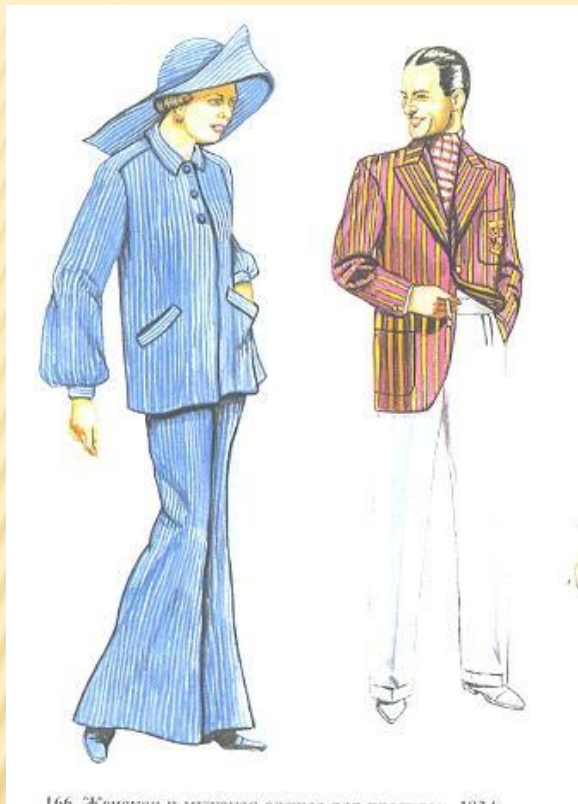
Одежда для прогулок 1934 год