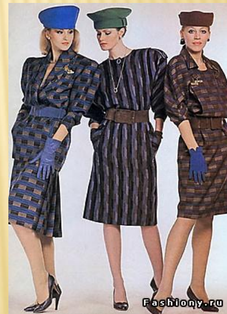
1990-2000. В моду плотно входит минимализм