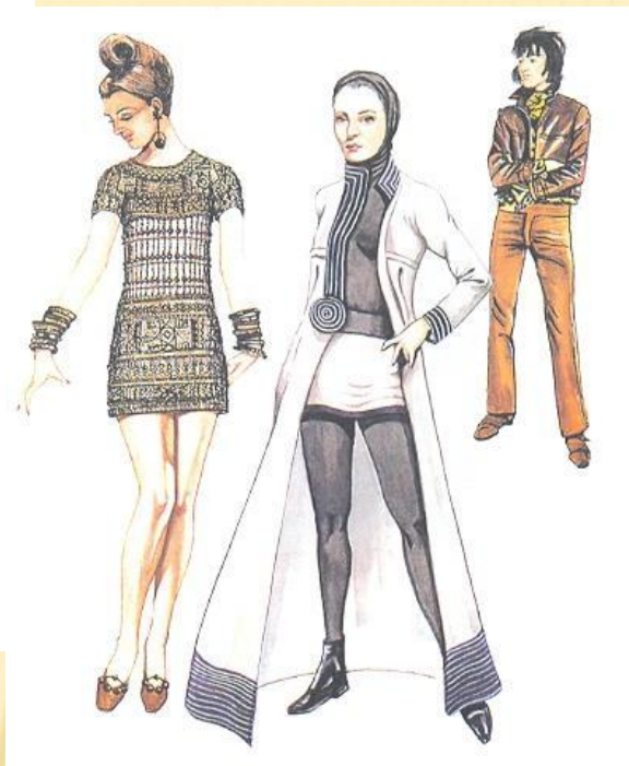
Мужской и женский стиль 1969 год