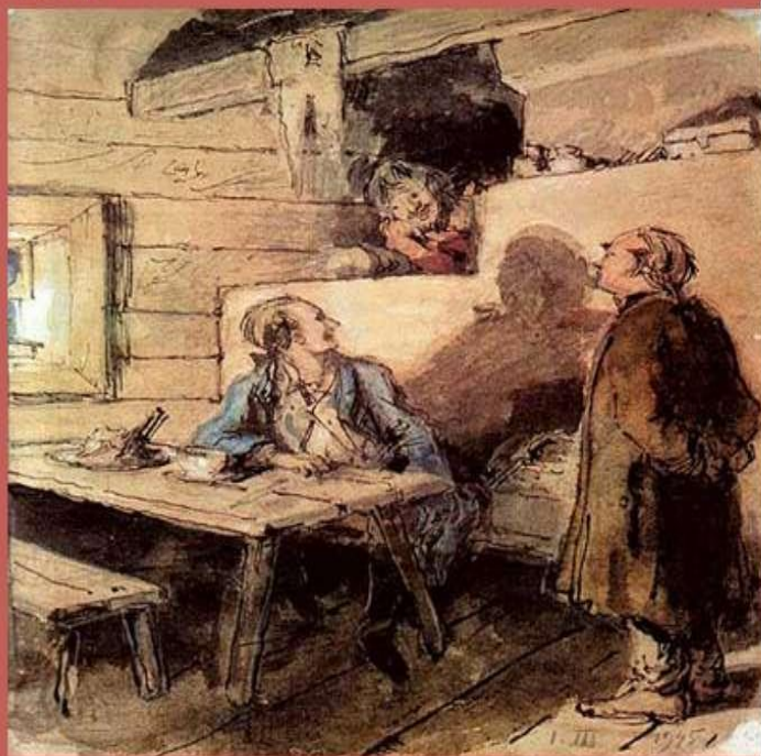
Иллюстрация к повести А.С. Пушкина «Капитанская дочка». 1945