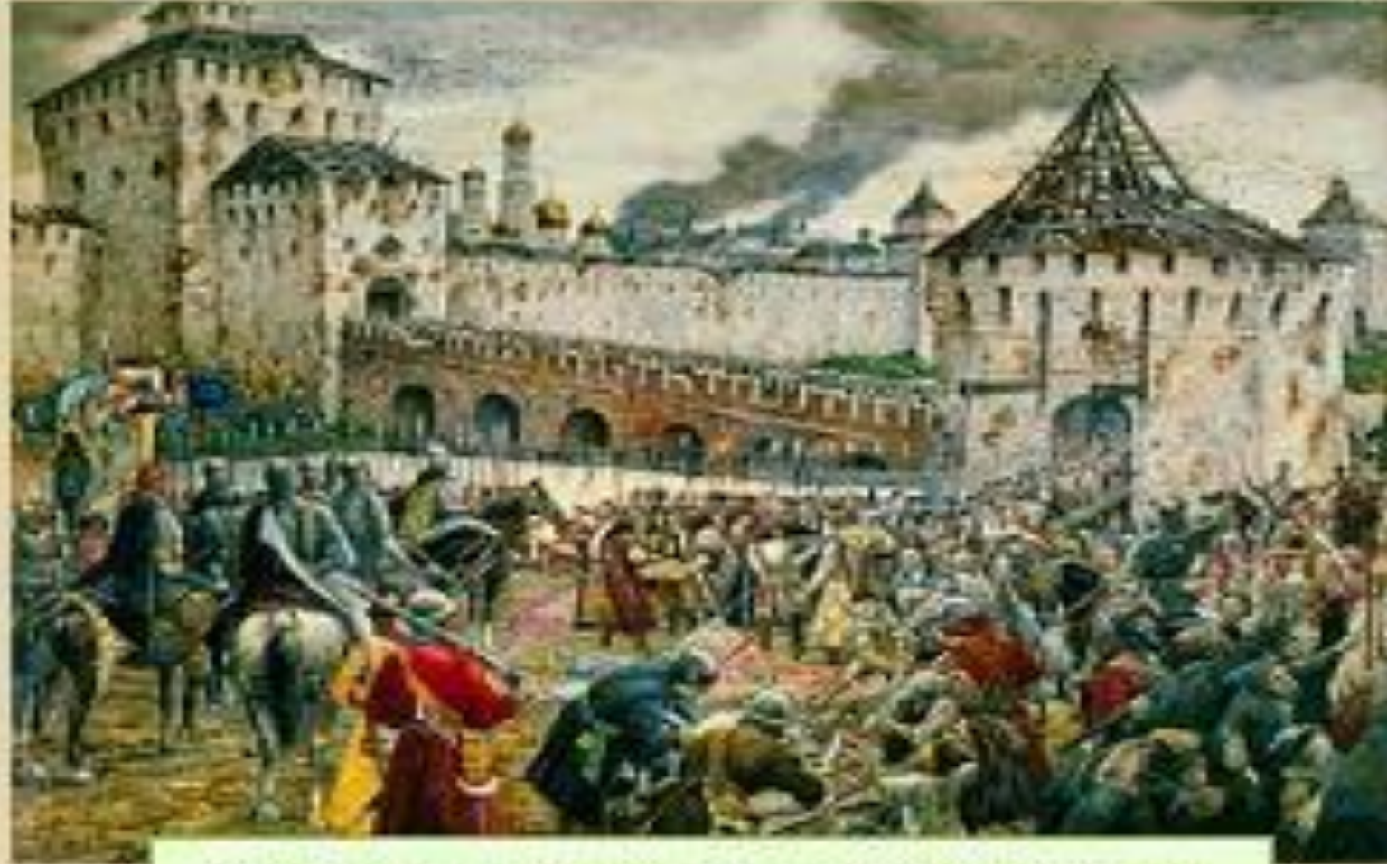
Изгнание поляков из Кремля

4 ноября 1612 года ополченцы К. Минина и князя Пожарского ринулись в бой с поляками за Москву. Никакая вражеская сила не могла остановить их. Сама Богородица благословила русских воинов на священную битву. Настал день, которого все ждали: враг был побеждён. Россия стала свободной, а её народ единым.