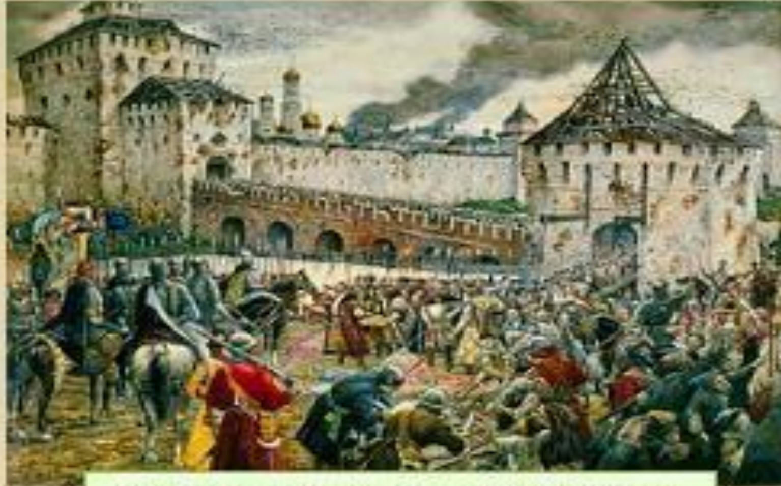
Изгнание поляков из Кремля

4 ноября 1612 года ополченцы К. Минина и князя Пожарского ринулись в бой с поляками за Москву. Никакая вражеская сила не могла остановить их. Сама Богородица благословила русских воинов на священную битву. Настал день, которого все ждали: враг был побеждён. Россия стала свободной, а её народ единым.