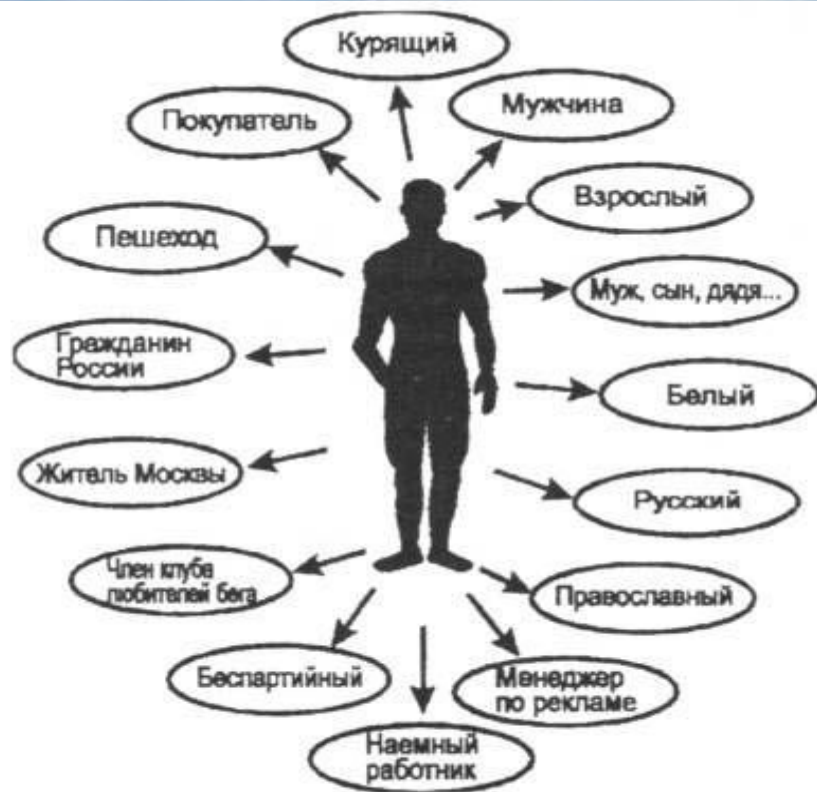
Статусный набор (портрет) человека