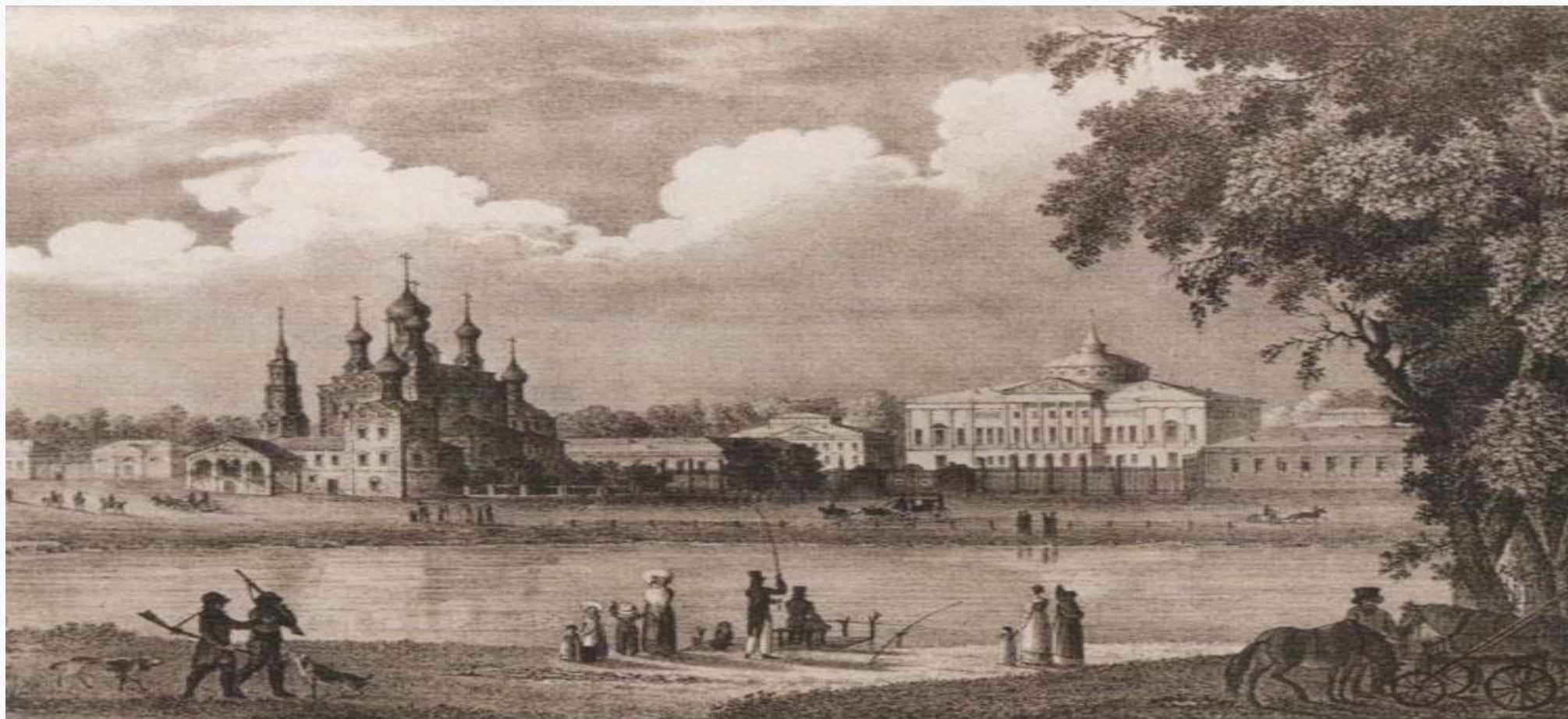
Дом Шереметьева в Останкине