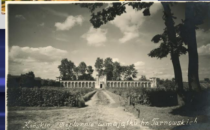
Końskie - ciepłarnie w majątku hr. Farnowskich